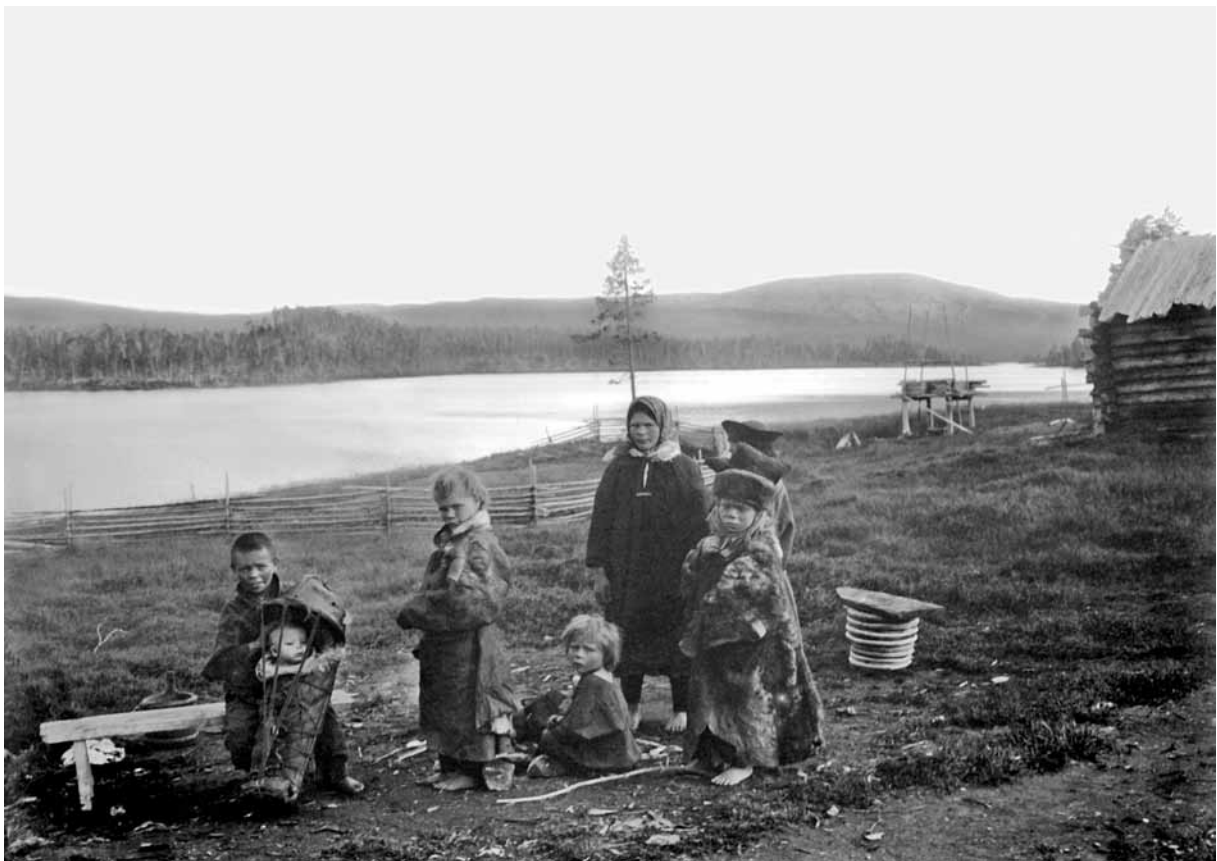
Menes-Antin lapsia. Kuva: Benjamin Frosterus, 1903. GTK, Vanhatkuvat nro 1049.

Menes-Antti ei kuitenkaan pystynyt hoitamaan kruunun asettamia velvoitteita ja joutui luopumaan tilasta. Antti kuoli pian tilasta luopumisen jälkeen ja perhe hajosi. Vanhemmat lapset pääsivät kasvattilapsiksi sukulaisille, mutta nuoremmat joutuivat huutolaisiksi.