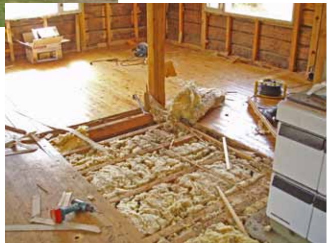
Lakatut kapealautaiset lautalattiat vaihdettiin maalattuihin leveämpilautaisiin lattioihin.