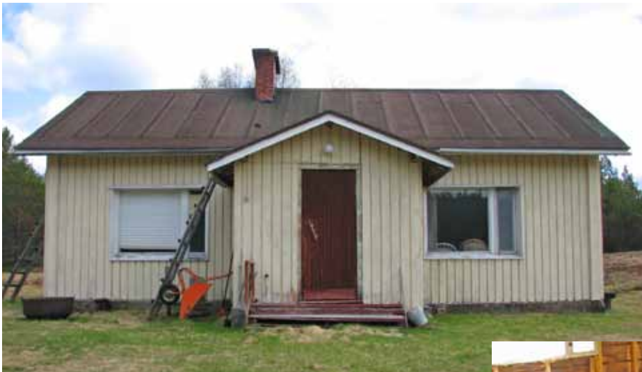
Päärakennus ennen entisöintiä.

rankorakenteinen. 1970-luvulla rakennukseen vaihdettiin ikkunat, vuorattiin ulkopuoli laudoilla, sisäpuoli levyillä ja vesikatto huovalla. Kunnos-tusta suunniteltaessa päädyttiin säilyttämään ulkuvuorilaudoitus, mutta sisäpuolen lastulevy-seinät korvattiin kuitulevyllä ja vanerilla. Ainoas-taan yksi sisäseinä oli niin hyvässä kunnossa, että se voitiin jättää hirsipinnalle. Muut seinät olivat täynnä koolausräjäkkeitä. Sisäkaton levyt irrotettiin ja vaihdettiin alkuperäisen kaltaiseksi helmipontti-katoksi.