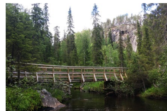
METSÄHALLITUS 2/2022.