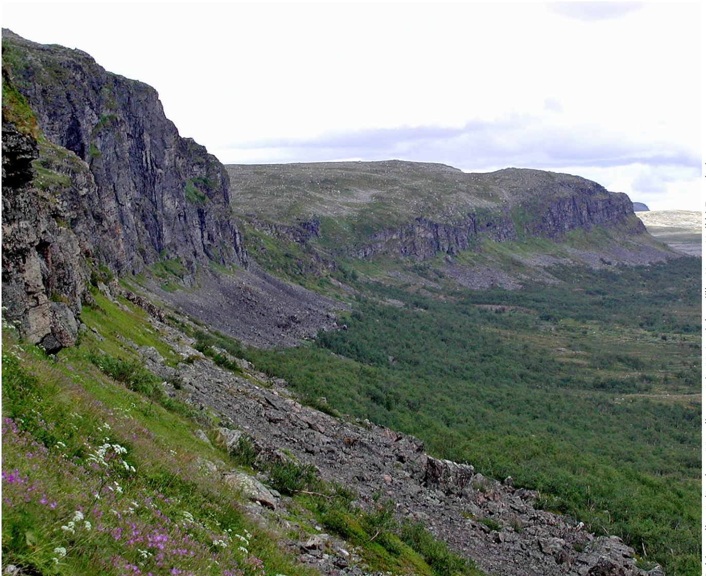
Pohjanvalkotäpläpaksupään elinympäristöä Annjaloanjilla.