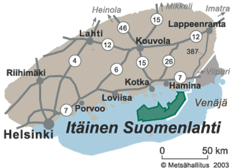
Kuva 1. Itäisen Suomenlahden kansallispuiston sijainti.

Merenkululla ja saaristoelinkeinoilla on pitkät perinteet Itäisen Suomenlahden kansallispuiston alueella. Kalastus, lintujen ja hylkeiden pyynti sekä pienimuotoinen maanviljely ja karjatalous ovat jättäneet jälkensä kansallispuiston maisemaan. Heti puiston rajojen ulkopuolella ovat Kaunissaaren, Haapasaaren ja Tammion saaristolaiskylät. Kaunissaaren vierasvenesatamassa on kesäisin avoinna oleva luontotupa kansallispuistoa esittelevine ”Tyrsky tuo ja vie” -näyttelyineen. Myös Haapasaaren vanha koulu toimii kesäisin luontotupana. Luontotuvan näyttely ”Rajatapaus” kertoo ulkosaariston luonnosta ja kansallispuiston asemasta Fennoskandian rajalla.