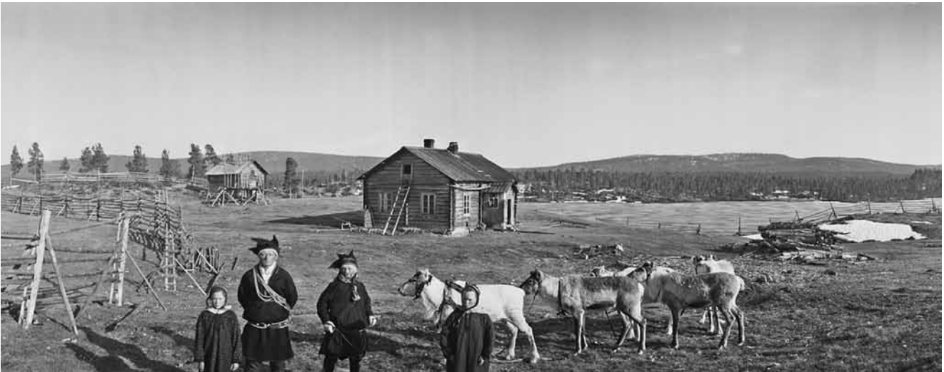
Gáppe-Jon báiki 1934:s.

Ánná-Gáppe oktan bearrašiin ásaiduvai Avviljohkii luoiti Áhppesjoga njálbmái vuodđuduvvon ruvnameahccetoarpái. Áigáibohtu bođii eanaš bohccuin. Ellá ii luoitán Gáppe gollerogganhomáide, muhto mieđai almmatge vuovdigoah-tit gollealbmáide biepmu. Gollealbmát mákse dieđusge biepmu golliin, ja ságaid mielde golli čoggostiige mealgat Gáppii. Dieđuid mielde son livččii čiehkkan golli ruovderuitui guovtte geađggi gaskii Áhppesjoga dálus Bátnejávrái manni bálgá gurii. Eai dieđe, lešgo gii nu gávdnan maŋnelis dien čiegá.