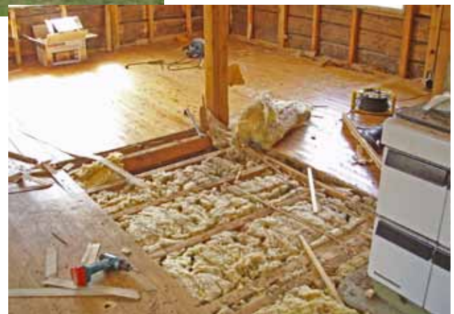
Láhkkejuvvon seakka fielluid sadjái láhttiide molsojuvvojedje málejuvvon govddit fiellut.