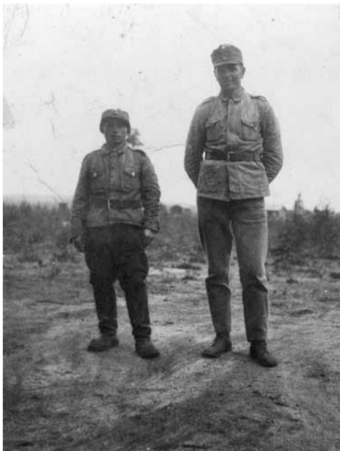
Soahteveaga oaneheamos ja guhkimus almmái, Unna-Jovnna ja lullialmmái.

Joatkkasohti buvttii goittotge fuolaid ja morraša maiddái Čoadgejávraí. Morašsáhka deai- vidii bearraša čakčat 1942, go Juhán Paulusa alm- muhedje gahččan gos nu Nuorta-Gárjilis. Davi- mus Lappis eai lean ieš soahtedoaimmat, muhto olbmot šadde ballat sovjetpartisánaid fallehe- miin. Boazoeaiggádiid giksin ledje bággoluohpa- deamit oppa joatkkasoadi áigge, bealli ealuin jávkkai soadi áigge. Boazobargguide ii báljo sáhttán bargat, go nuorra albmát ledje soadis.