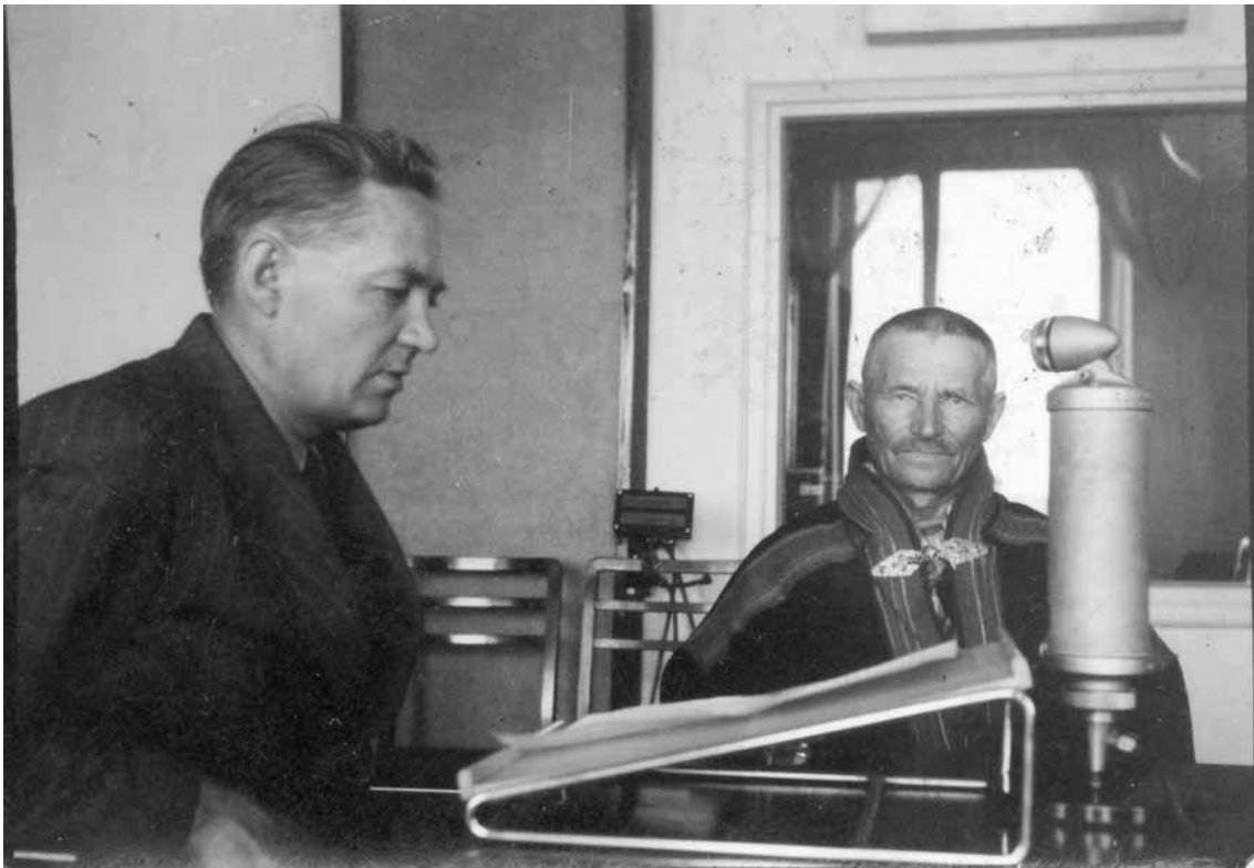
Gáppe-Jovvna Yleisradio jearahallamis 1944:s.

Kekkonen finai Hilliläin Leammis moatte jagi geažes. Hillilä lei ovdalaš nammaduvvon Lappi eatnanhearrán. Dalle verdežat vásihedje eahkeda áibbas nuppelágan dilálašvuodain – goađi luhtte dollagáttis. Jovvna lei duhtavaš, go lei fuobmán huksehit stuorábuš stobu – dasa čáhke idjadit nu ministarat go earáge johttit.