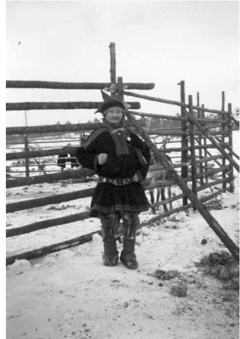
Gáppe-Jovnna gárddástallamin.

Bohccuid lassin dálus lei soames gussa ja maiddá sávzzat. Daid muhkkiiguin sáhtii duktet bealddu nu, buđetge šattai. Jávrriin ja jogain lei guolli ja meahcis fuođđut.