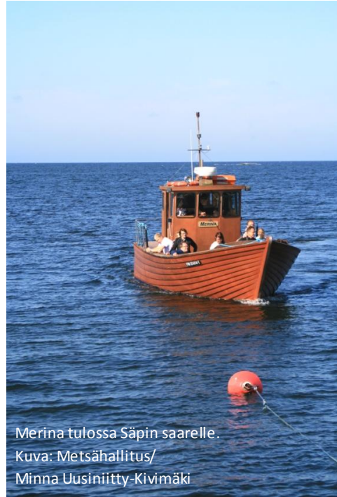
Merina tulossa Säpin saarelle.

Kesäaikaan 24.6.–16.8.2014 Uudestakaupungista Isonkarin majakkasaarelle pääsee vesibussi Dianan sekä brigantiini Mary Annin matkassa. Vesibussi Dianan kyydissä pääsee Isonkarin lisäksi Uudestakaupungista myös Katanpään linnakesaarelle. Myös brigantiini Mary Ann risteilee kesäaikaan Uudestakaupungista Kustavin kautta Katanpään. Lisäksi Kustavin Lootholmasta pääsee Katanpään. Liput risteilylle tulee varata vähintään päivää ennen lähtöä. Uudestakaupungista lähtevien risteilyjen aikataulut, tiedustelut ja lippujen varaukset Uudenkaupungin matkailutoimistosta (Rauhankatu 10, Uusikaupunki) p. 02 8451 5443, 02 8451 5455 tai matkailu@uusikaupunki.fi ja Kustavista lähtevien risteilyjen aikataulut maritta.jalonen@kustavi.fi , matkailuneuvonta@kustavi.fi tai p. 02 842 6600, kesä-elokuussa myös Kustavin matkailuinfo, p. 02 842 6620.