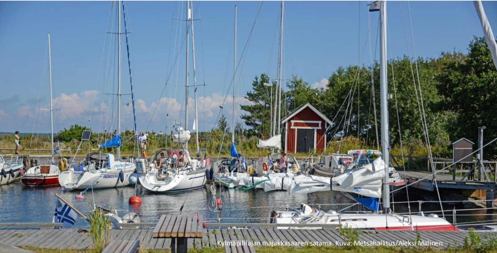
Kylmäpihlajan majakkasaaren satama.