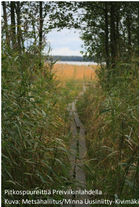
Pitkospuureittiä Preiviikinlahdella

Selkämeren kansallispuistossa voi aina liikkua omalla veneellä tai tilausveneellä, ja kansallispuiston mannerkohteissa voi vierailla ilman venettäkin. Mannerkohteita on Merikarvialla, Porissa ja Uudessa kaupungissa. Merikarvian Sälttöössä on laavu ja nuotio paikka. Porin Preiviikinlahdella voi retkeillä pitkospuureittejä pitkin ja tarkkailla vaikkapa lintuja luontotorneista ja lavoilta. Uudenkaupungin Liesluodossa voi tarkkailla merta ja lintuja, mutta sieltä ei löydy retkeilypalveluja.