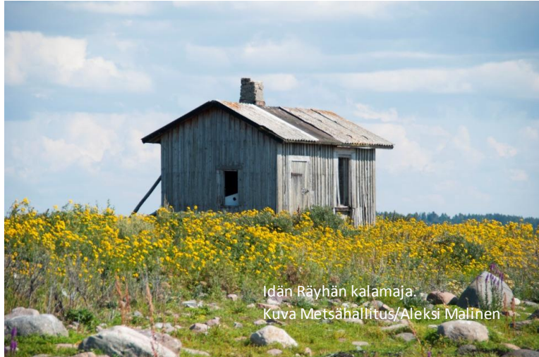
Idän Rähän kalamaja.

http://www.rakennusperinto.fi/kulttuuriymparistopaivat