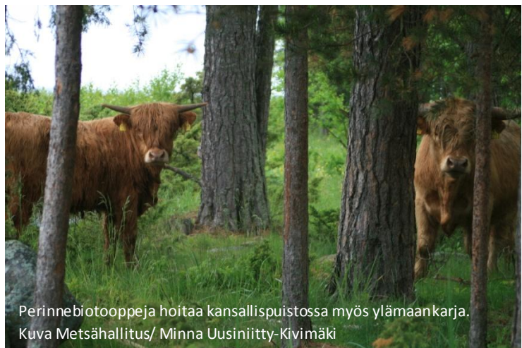
Perinnebiotooppeja hoitaa kansallispuistossa myös ylämaankarja.