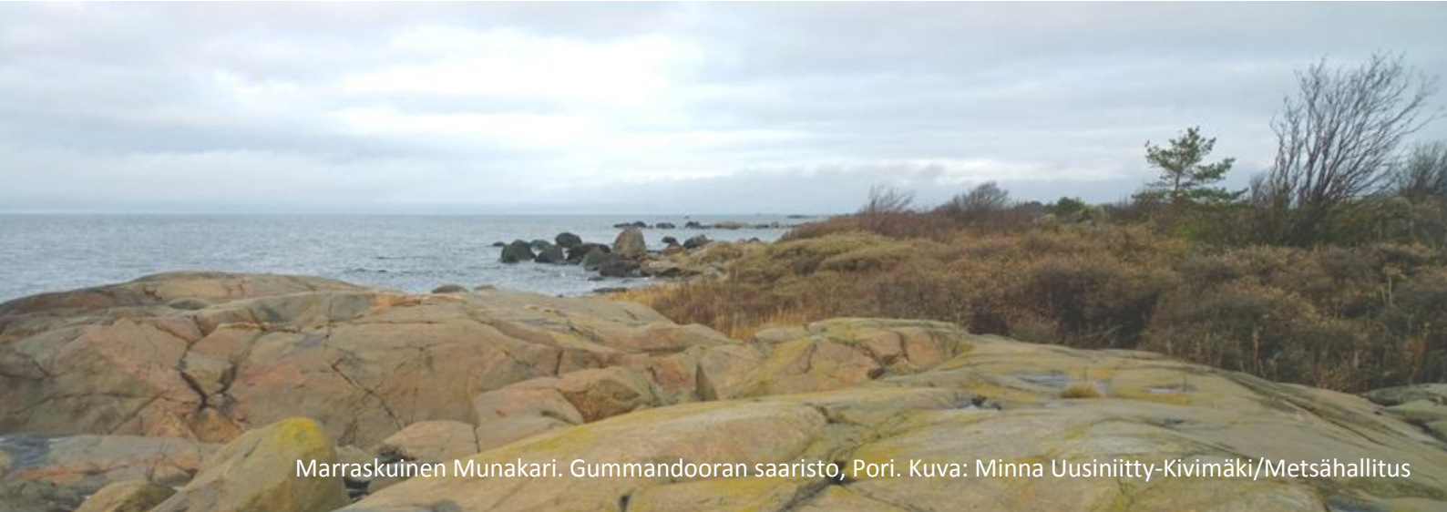
Marraskuinen Munakari. Gummandooran saaristo, Pori.

Rauhallista Joulua ja Onnea Vuodelle 2016!