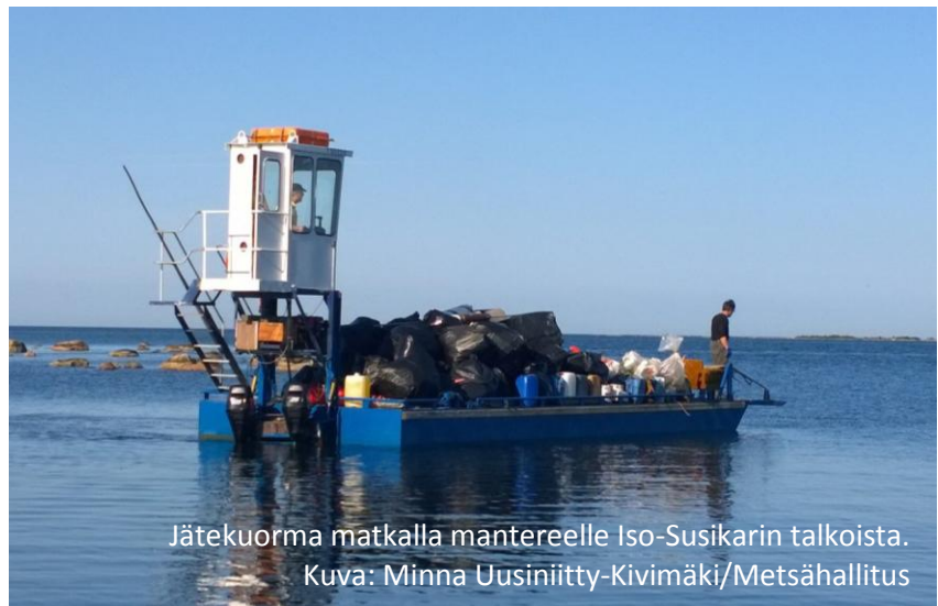
Jätekuorma matkalla mantereelle Iso-Susikarin talkoista.

Aiempien vuosien tapaan myös tänä vuonna on hoidettu luontoa, korjattu rakennuksia ja parannettu kävijäpalveluita yhdessä vapaaehtoisten kanssa. Työt on osin toteutettu yllä mainittujen hankkeiden yhteydessä. Esimerkiksi kesä-heinäkuun vaihteessa Säpissä järjestettiin edellisen vuoden tavoin kaksiviikkoinen kansainvälinen