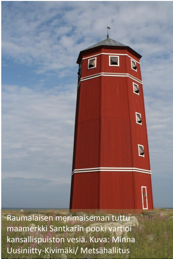
Raumalaisen merimaiseman tuttu maamerkki Santkarin pooki vartioi kansallispuiston vesiä.