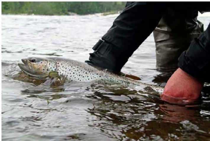
TAIMEN MERKITÄÄN JA PÄÄSTETÄÄN VAPAUTEEN.