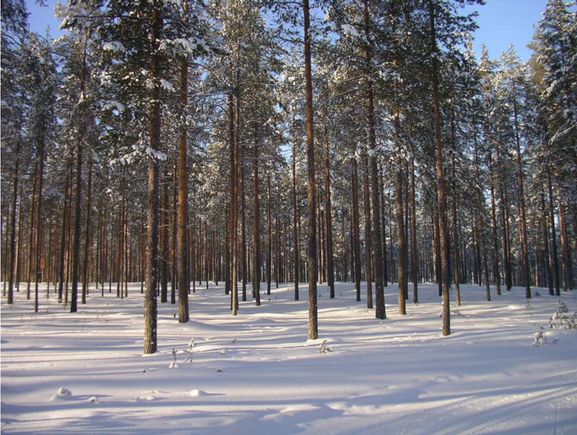
Kuva 2. Mäntykankaan varttunutta harvennusmännikköä

Leirikankaan ensiharvennushakkuut tehdään Mäntykankaan hakkuiden kanssa samoihin aikoihin. Harvennusvoimakkuus on harvennusmallien mukainen. Ajourapainaumien syntymistä on täälläkin pyrittävä estämään.