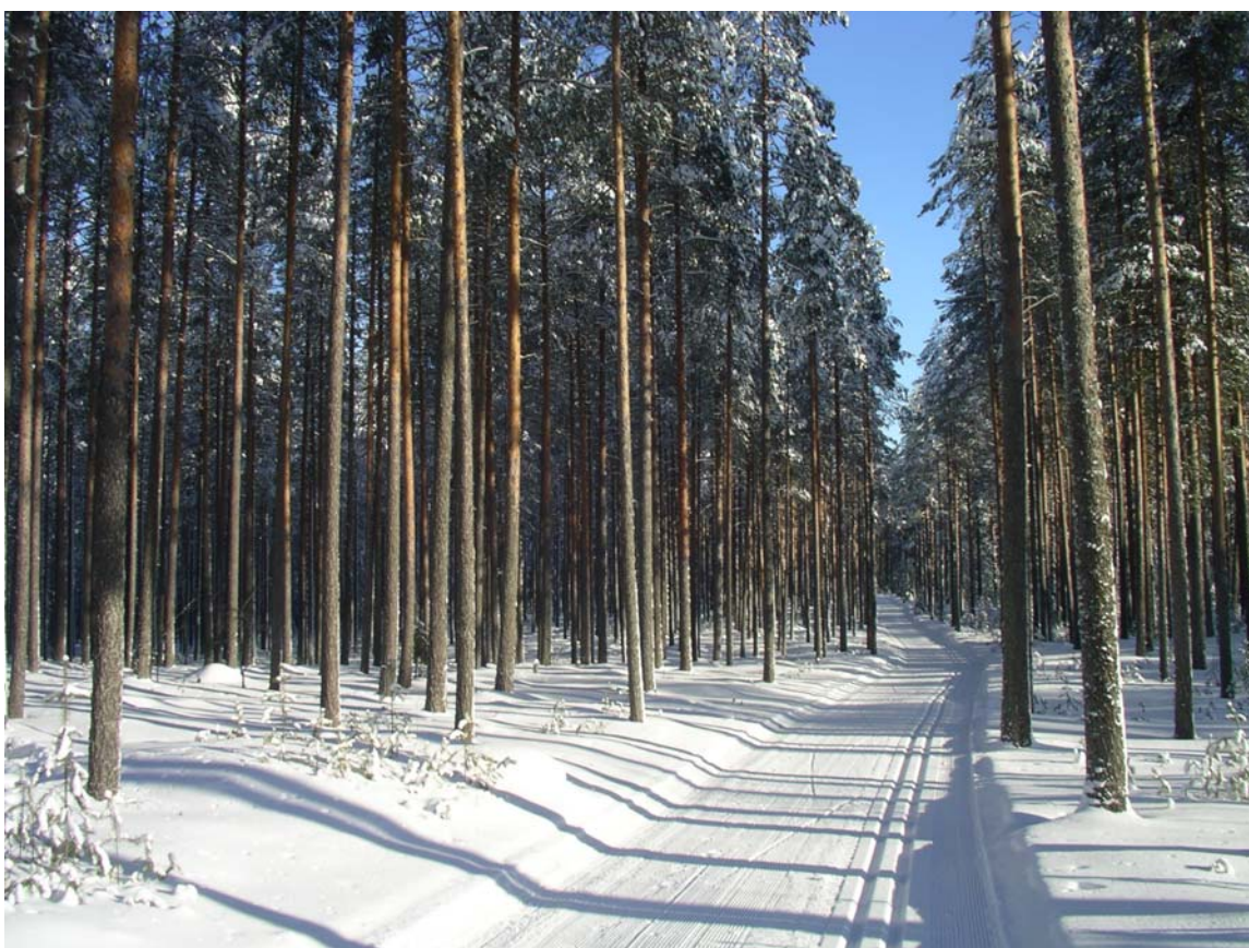
Kuva 1. Koiravaaran itäosan tiheää, uudistuskypsää männikköä hiihtouran varrella

Koiravaaran eteläpuolella , Sotkamon tien ja Kangasjärven välisellä alueella tapahtuvat hakkuut toteutetaan rajavartioston (tai neuvottelujen jälkeen selviävän muun haltijan) kanssa sovittavalla tavalla.