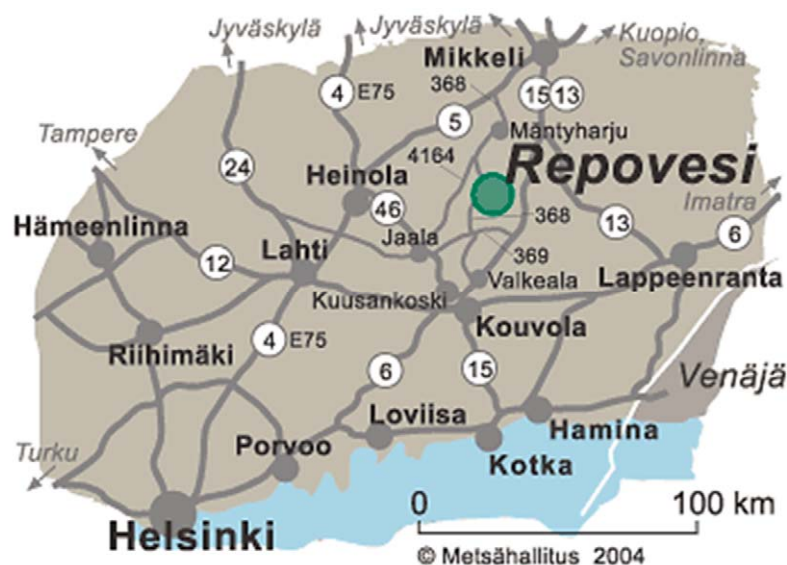
Kuva 1. Repoveden kansallispuiston sijainti.

Alueen kuvauksessa on käytetty lähteinä Repoveden kansallispuiston hoito- ja käyttösuunnitelmaa (Metsähallitus 2004), Luontoon.fi-verkkopalvelun Repovettä esitteleviä sivuja (Metsähallitus 2016a), visitrepo-vesi.fi-verkkosivuja (Metsähallitus 2016b), Repovesi-kirjaa (Häyrinen & Kujala 2003) ja Repoveden kävijätutkimuksia (Niskala 2003, Hemmilä 2008, Nylander 2017a).