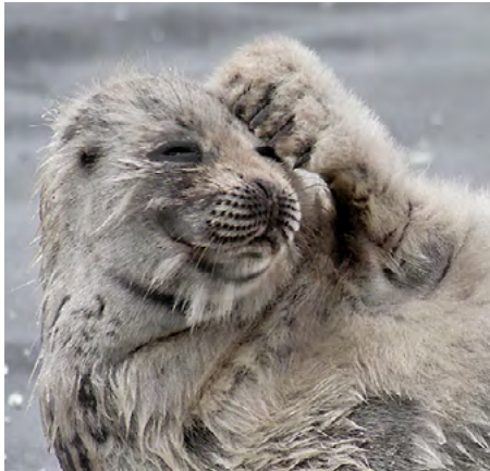
Saimenvikarbeståndet håller på att återhämta sig.

Forststyrelsens Naturtjänster ansvarar för skötseln och användningen av nätverket av naturskyddsområden på statliga mark- och vattenområden i hela Finland. På privata naturskyddsområden samarbetar vi med ägarna och NTM-centralerna. Till våra huvuduppgifter hör också att erbjuda dem som rör sig i naturen bra friluftskonstruktioner och kundservice.