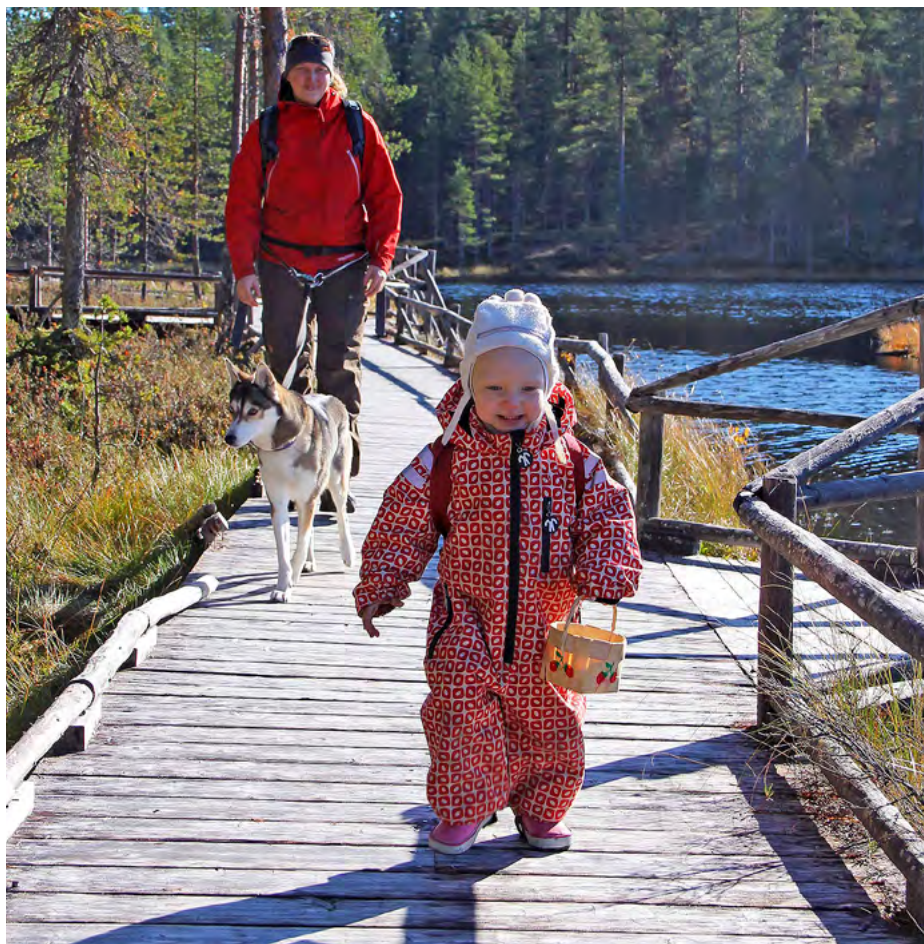
Turvalliset retkipalvelut innostavat lapsiperheitä kansallispuistojen hienoihin maisemiin.

Laskimme 23 luonto- ja historiakohteelta ns. hyvinvointi-indeksin vuosilta 2013–2016. Kävijät arvioivat käynnillä kokemansa terveys- ja hyvinvointivaikutukset: keskiarvo oli 4,25 asteikolla 1–5. Kävijöistä 82 % kokee vierailulla olleen niitä melko tai erittäin paljon. Kävijät arvioivat käynnit noin 100 euron arvoisiksi.