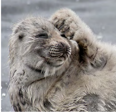
Saimaannorppakanta on elpymässä.

Metsähallituksen Luontopalvelut vastaa koko Suomen luonnonsuojelualueverkoston hoidosta ja käytöstä valtion maa- ja vesialueilla. Yksityisillä suojelualueilla toimimme yhteistyössä niiden omistajien ja ELY-keskusten kanssa. Toinen päätehtävä on tarjota luonnossa liikkujille hyvät retkeilyrakenteet ja asiakaspalvelu.