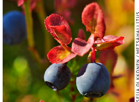
SEIJA OIKKONEN / METSÄHALLITUS