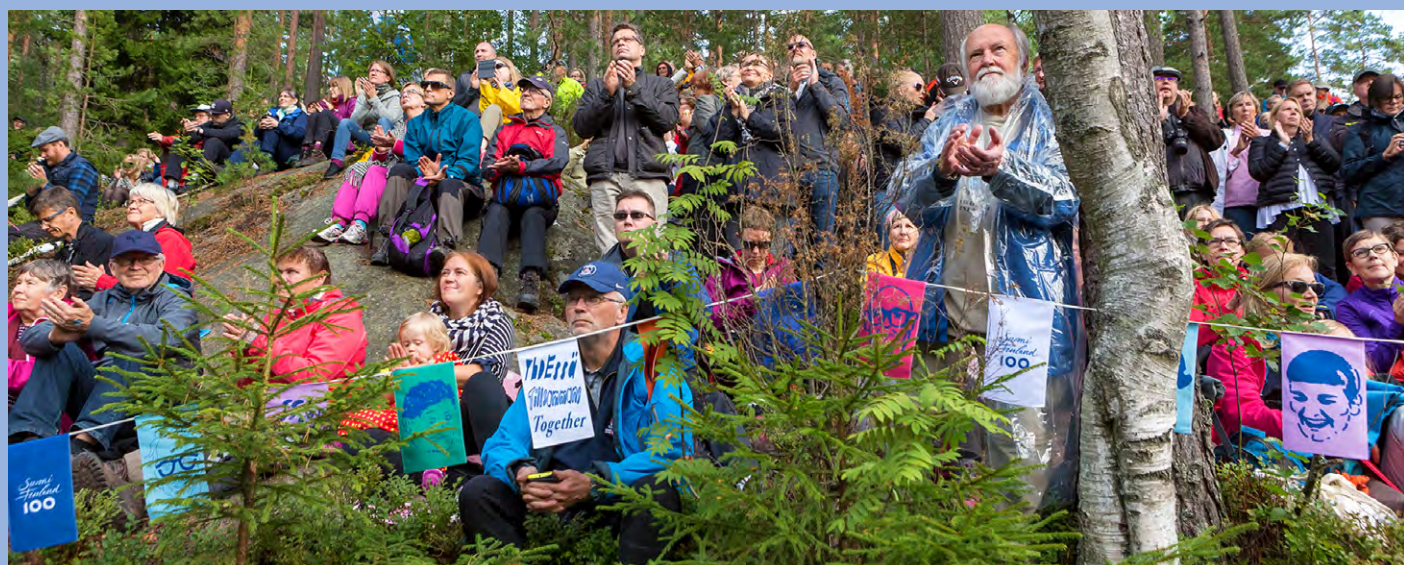
Över 55 000 personer deltog i evenemangen under den finska naturens dag den 26 augusti 2017. JARI KOSTET