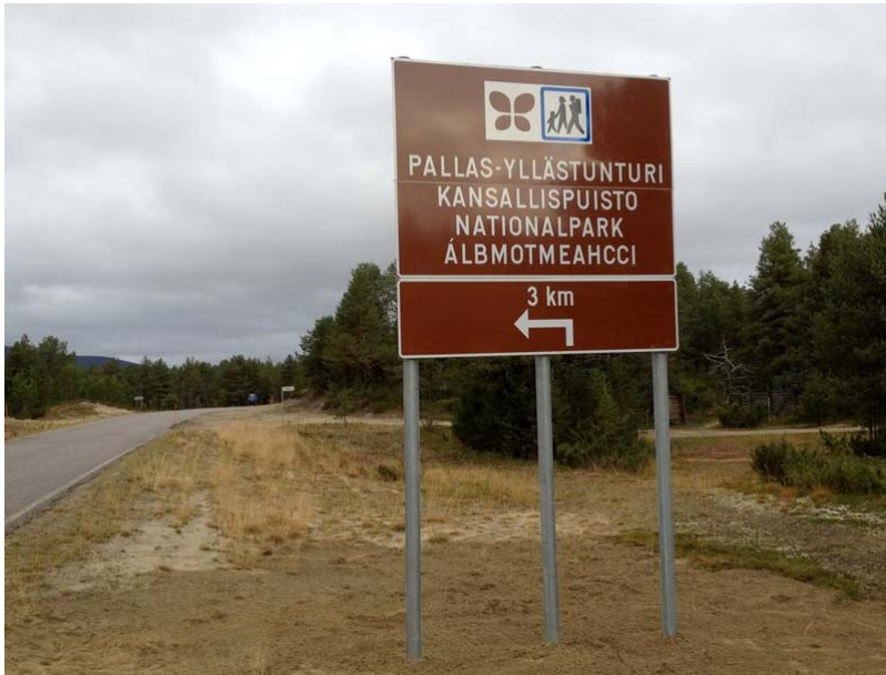
Kuva 1. Hankkeessa suunniteltu kansallispuiston lähestymisliikennemerkki asennettuna