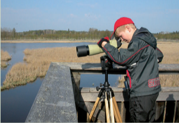
Luondu šaddá oahpisin Siikalahiti luonddusuodjalanguovllus. Suodjalanguovllut fáallet vásáhusaid miel oahppanbirrasiid buotahkásaččaide. Luondduguovddážiin leat fállun čájáhusat, gárvvies prográmmat ja bargomateriálat skuvllaide.

sain ledje suodjalanguovlluin measta 60 EU-ruhtadan ovttasbargoproševtta, maiddá bohte mielde ee. eallinbiras- ja šládjasuodjalepmi, mearraviidodagaid plánen, luondduturisma ja birasbajásgeassima ovddideapmi, sihke dálanguovllu ja rádjeduogáš suodjalanguovlluid gárgeheapmi. Fárus leat leamaš logiid mielde guoimmit ja eatnatlohkosaš čanusjoavkkut. Lagašovttasbargu ránnáriikkaiguin doarju Suoma luonddu suodjaleami. Earenoamáš mearkašahhti meahcebárraovttasbargu lea ng. Ruoná avádagas Ruošša ráji nalde, Norggain kalohttaguovllus ja Ruotain Mearračoddagis.