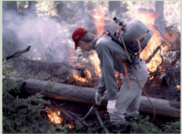
Ovdeštanboaldima cahkkeheapmi. Dutkamušain leat bastán gávnna- hit boaldimiid dahkat vuvddiid ráhkadusa jođánit mánggabeallásažžan ja máhcahit lunddolaš šlájaid.

Eanas Suoma suodjalanguovlluin leat hui buori ortne- gis, iige daid suodjalanárvvuide čuoze mearkkašahti uhkki. Doaibmabirrasa gárggiideapmi bearráigehččo- juvvo goitge geažos áigge ja suodjalanárvvuide čuoheci deattut viggojuvvojit geahpiduvvot ja uhkit dustejuvvo. Dikšundoaimmat ollašutttojuvvojit maiddái luondduárvvuid máhcaheami ja bajásdoal- lama várás. Lulli-Suomas ovddit eanangeavaheapmi ja olggobeal geavahandeaddagat sihke lassáneaddji huksen ja johtalus váikkuhit unna suodjalanguvllóiid ekologijai. Čáhceluonddu mánggahámatvuoda noađuha nuoskun ja dan liiggas šattolažžan šaddan. Amasvuodot šlájat dagahit vahága, omd. miñkkat duššadit lottiid sulluin ja láktabáikkiin. Davvi-Suo- mas boazodoalu váikkuhusat leat hui viidát maiddái suodjalanguovlluin ja lassáneaddji meahcejohtalusa vahádat leat báikkálaččat mearkkašahttit. Dálkká-