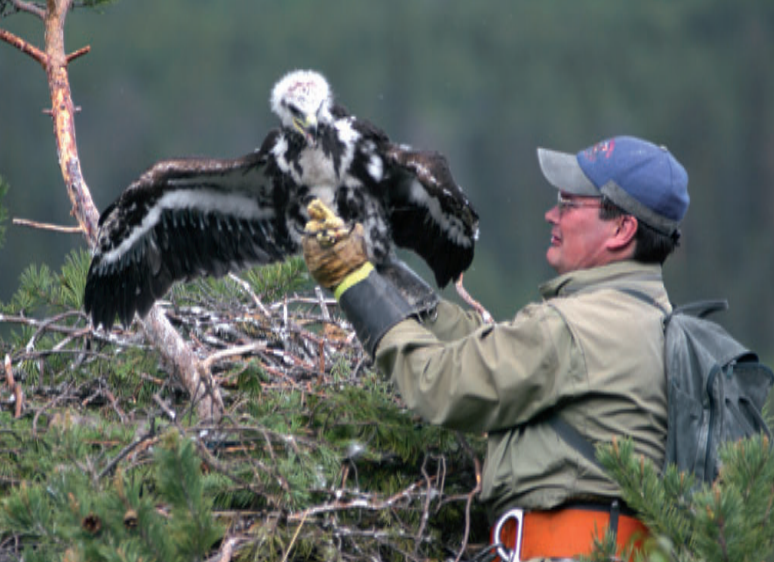
Beassedárrkisteaddji goaskima ( Aquila chrysaetos ) beasi luhtte. Šlájá máddodat lea hiljážit nanosmuvván ja lea dálá áigge 400–430 bára, main 40 % eallá suodjalanguovlluin.