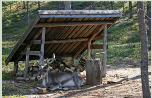
Luondduturisma bistevašvuohta gáibida nu vánddardanbálvalusaid birasváikkuhusaid go báikkálaš kultuvrra vuhtii váldima.

Boahteáigge gárgehuvvo viidáseappot ulbmillaš ja čuozihuvvon bálvalusaid huksen ja bajásdoallu, suodjalanguovlluid áhpásnuvvan- ja meahcegeavahusa bearráigeahčču sihke áhpásnuvvangeavahusa váikkuhusaid árvoštallan ja raporterren. Ulbmilin lea, ahte jagi 2010 rádjái luonddu áhpásnuvvangeavahusa ekologalaš bistevašvuođa bearráigeahčču lea turismaguovlluid stáđásnuvvan doaimma oassi.