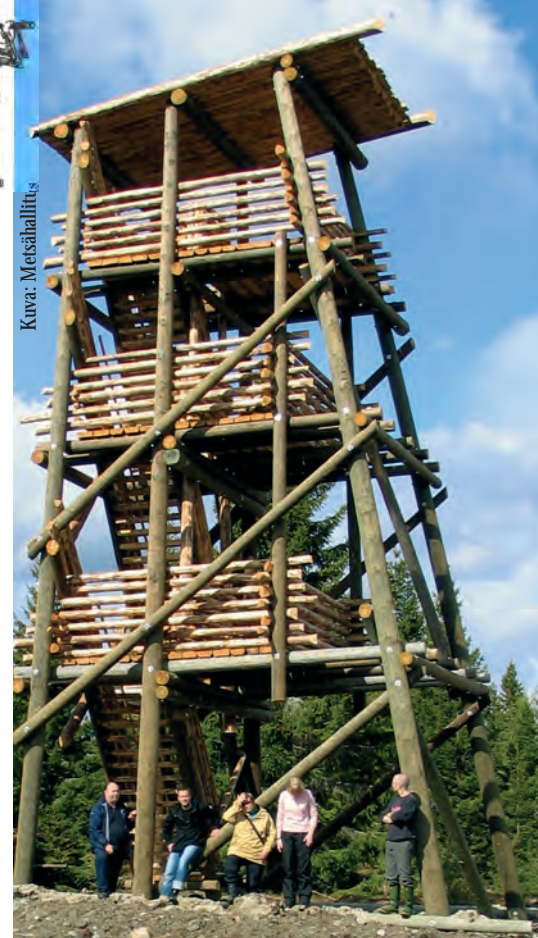
Kirkaslammen lintutornista avautuu huikea näkymä liki silmän kantamattomiin jatkuvalle aavalle Olvassuolle.