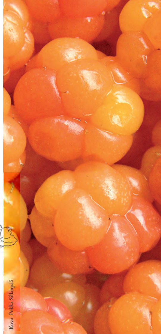
Kuva: Pekka Sillanpää