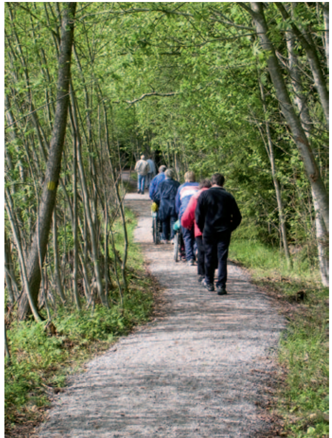
Helppokulkuinen luontopolku Jämijärvellä, Hämeenkanalla, vie Uhrilähteen maisemiin. Myös monissa kansallispuistoissa on vastaavia palveluita, jotta jokainen pääsee lähelle luontoa. RAMI TUOMINIEMI

Tammisaaren saaristoon ja Hangon itäisen saaristoon tehtiin Metsähallitusta sitova, mutta muille maaomistajille ainoastaan suositusluonteinen hoito- ja käyttösuunnitelma. Pääosa suunnittelualueesta kuuluu Natura 2000 -verkostoon. Satakunnassa sijaitsevan Hämeenkankaan harjoitusalueen hoito- ja käyttösuunnitelmassa sovitamme yhteen alueen eri käyttömuotoja. Erityisesti otetaan huomioon puolustusvoimien harjoituskäyttö, luonto- ja kulttuuriarvot sekä virkistyskäyttö ja maisemanhoito.