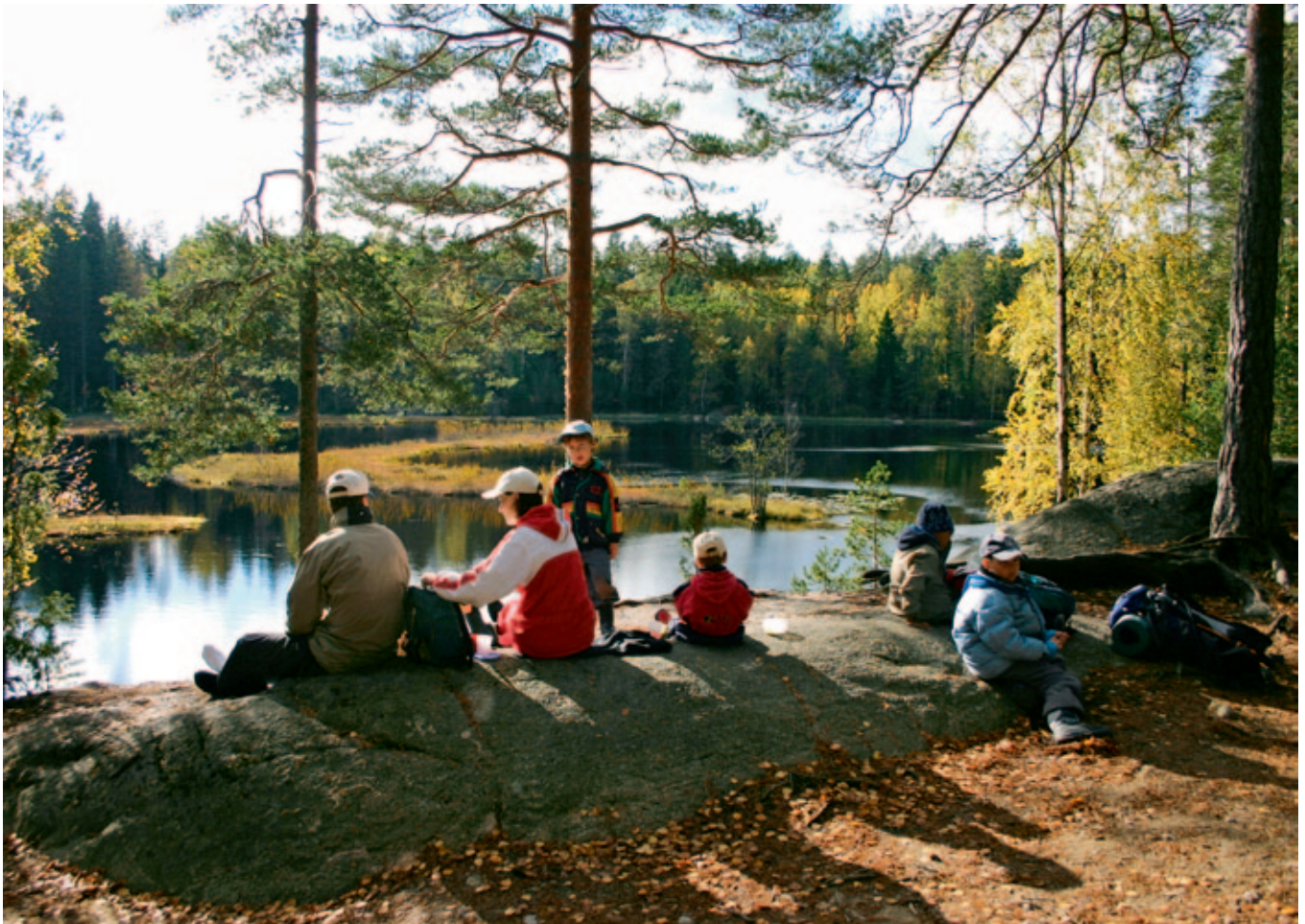
Retkeilijöitä Nuuksion kansallispuistossa.