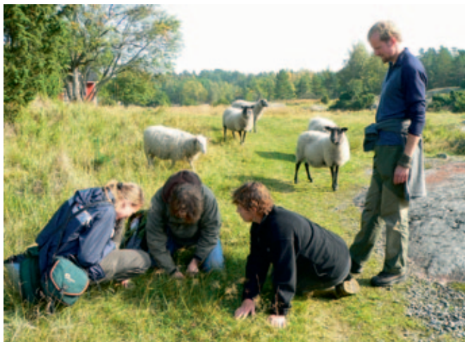
Forskning och inventering ingår i skötseln av värdbiotoper. Experter från Forststyrelsen och Finlands miljöcentral undersöker svampar på betesmarkerna på Jussarö i Ekenäs skärgårds nationalpark. RUUT RABINOWITSCH-JOKINEN

Naturskyddsverksamhetens mål är att skydda naturens mångfald och kulturvärdena. Verksamhetens kärna utgörs av nätverket av skyddsområden och i första hand dess natur och kulturmiljöer. Det nära samarbetet med universitet och forskningsinstitut samt internationella expertorganisationer förbättrar verksamhetsmetoderna och kvaliteten på vårt kunskapsmaterial.