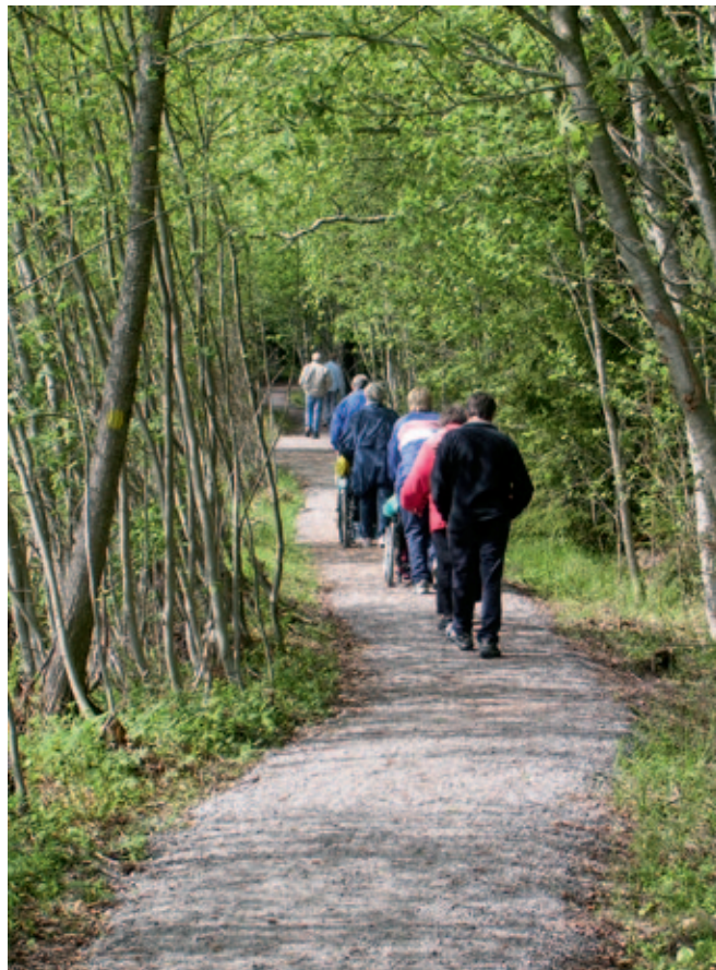
Den lättillgängliga naturstigen i Jämijärvi, Hämeen kangas, tar besökaren till Uhrilähde ('offerkällan'). Också många nationalparker har motsvarande service så att alla ska ha möjlighet att komma nära naturen. RAMI TUOMINIEMI

I skötsel- och användningsplanen för Hämeen kangas övningsområde i Satakunta samordnar vi områdets olika använd-