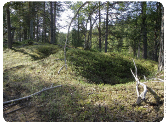
Två fångstgropar för ren i Tsarmitunturis ödemarksområde.