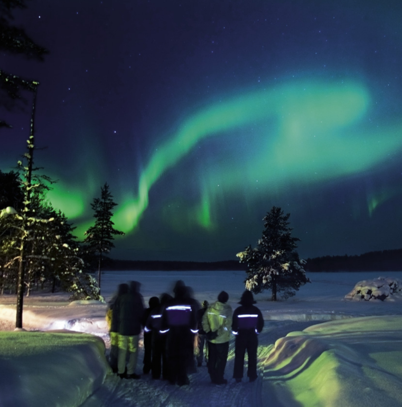
Nationalparkerna är turistområdenas attraktionsfaktorer. God turistservice i närheten av dem får turisterna att stanna längre i området och besöka även andra objekt.