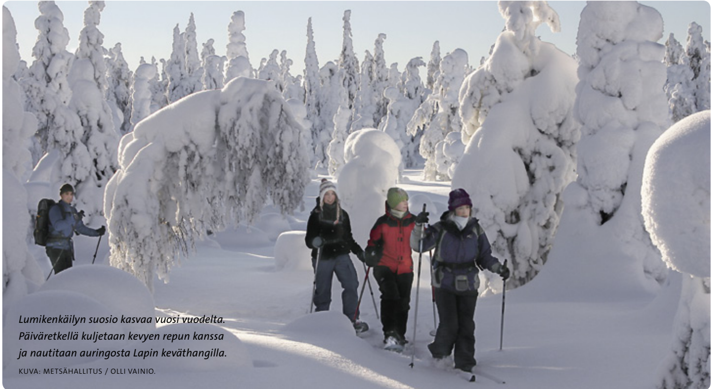
Lumikenkäilyn suosio kasvaa vuosi vuodelta. Päiväretkellä kuljetaan kevyen repun kanssa ja nautitaan auringosta Lapin keväthangilla.

Vuoden 2010 toiminnassa näkyvät erityisesti rannikkohankkeet, joista useimmat ovat osin EU:n rahoittamia. Porvoon edustalla aloitimme Söderskärin majakkasaaren historiallisten rakennusten korjauksen. Itäisen Suomenlahden kansallispuistossa olivat käynnissä majoitustilojen ja kulttuurimaisemien kunnostustyöt matkailun edistämiseksi. Merenkurkun saariston maailmanperintöalueella olemme Fenikshankkeiden ansiosta luoneet kumppanimme kanssa retkeilyn peruspalveluja siten, että ainutlaatuisen maannousurannikon luonto ei vaarannu.