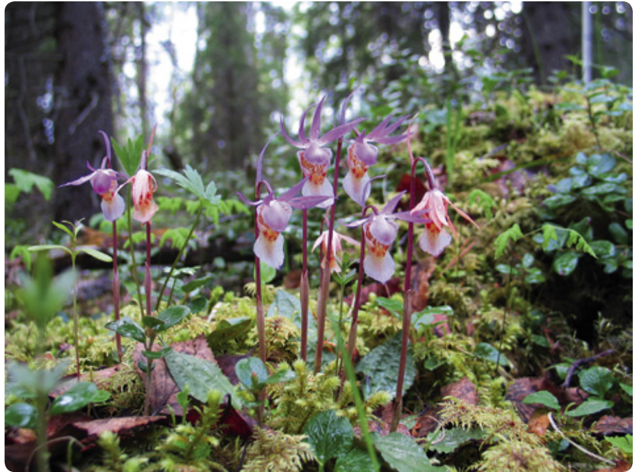
Kansallispuistot ja suojelualueet tarjoavat suojan harvinaiselle neidonkengälle (Calypso bulbosa), jonka havaintopaikkoja on koko Suomessa vain noin tuhat.

– Lisäämme myös kansalaisten tietämystä suoluonnosta ja tuotamme elämyksiä. Yksi kohderyhmä ovat esteettömiä retkeilypalveluita tarvitsevat kansalaiset, hankkeen projektipäällikkö Mikko Tiira kertoo. Ensimmäisenä vuonna teimme ennallistamissuunnitelman 8 kohteelle, raiivasimme puustoa jo 16 kohteella yhteensä yli 400 hehtaarin verran ja tukimme oja