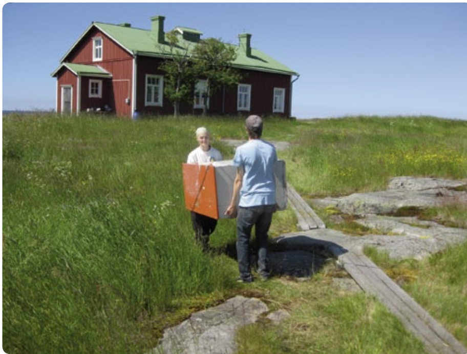
Ungdomar anställda med sysselsättningsstöd kavlade upp ärmarna sommaren 2010 bl.a. på världsarvsområdet i Kvarkens skärgård.

Naturen erbjuder arbete åt dem som bor nära den. Forststyrelsens naturtjänster sysselsätter människor i samtliga landskap – såväl direkt som indirekt.