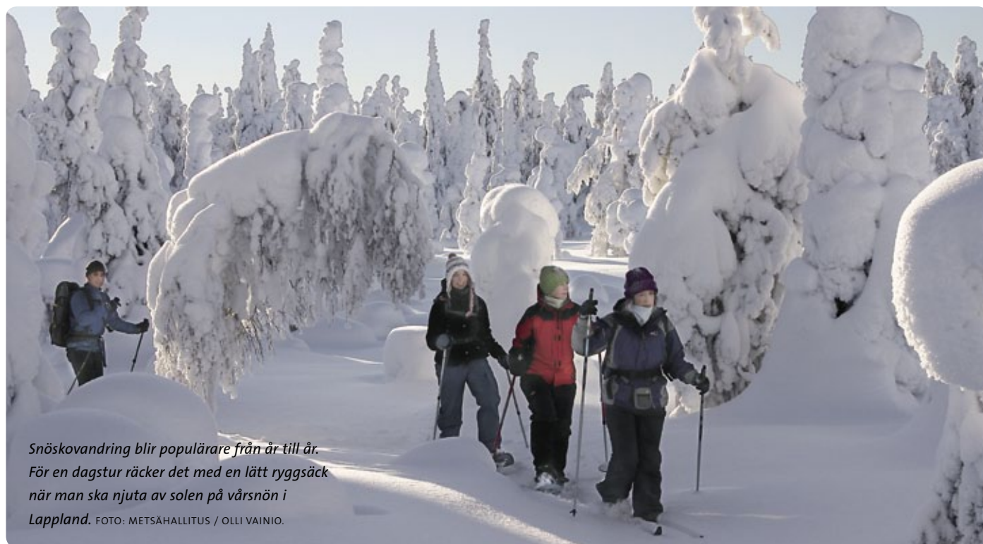
Snöskovandring blir populärare från år till år. För en dagstur räcker det med en lätt rygsäck när man ska njuta av solen på vårsnön i Lappland.

Kustprojekten är särskilt synliga i verksamheten 2010. De flesta är delfinansierade av EU. Utanför Borgå började vi reparera de historiska byggnaderna på fyrholmen Söderskär. I Östra Finska vikens nationalpark iståndsattes inkvarteringsutrymmen och kulturlandskap för att främja turismen. På världsarvsområdet i Kvarkens skärgård har vi tack vare Feniks-projekten utvecklat grundläggande friluftstjänster tillsammans med våra partner så att naturen på den unika landhöjningskusten inte ska äventyras.