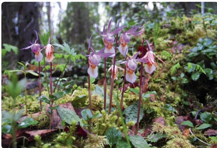
Nationalparker och skyddsområden erbjuder den sällsynta nornan (Calypso bulbosa) skydd.

Första året gjorde vi upp en restaureringsplan för 8 objekt, röjde träd på 16 objekt omfattande sammanlagt över 400 hektar och täppte till diken på nästan 700 hektar. Före restaureringen utförde vi övervakning av bl.a. dagfjärilar, trollsländor och ljungpipare tillsammans med projektpartnererna, så att vi kan kontrollera hur