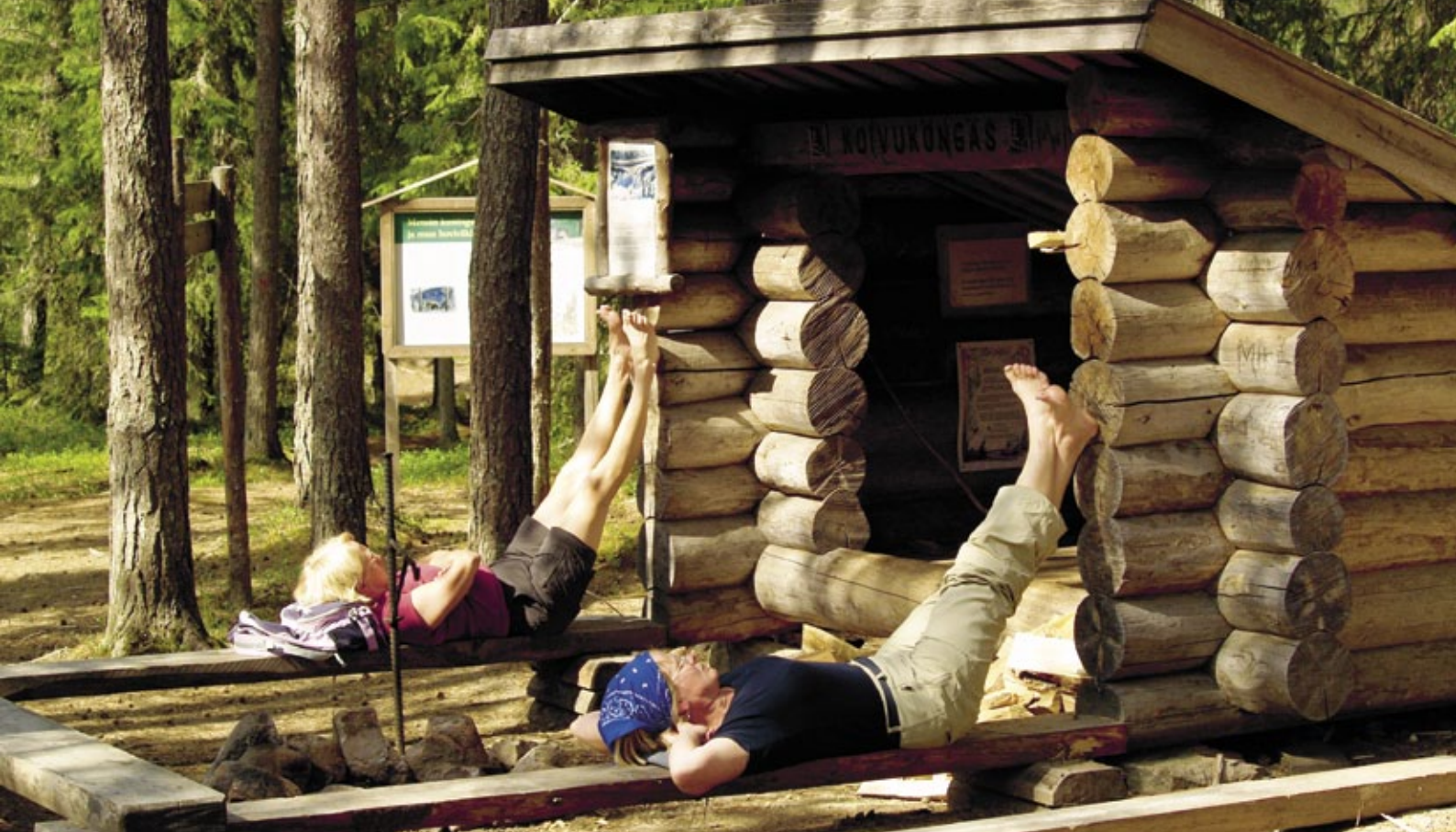
Koroumas naturskyddsområde i Posio lockar isklättrare på vintern och inbjuder sommartid till avslappnande friluftsliv.