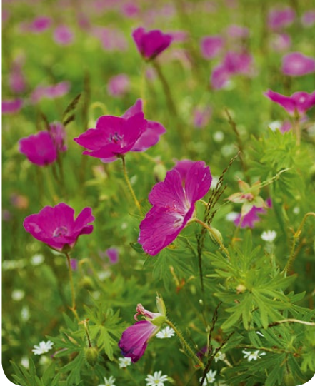
Verikurjenpolvi ( Geranium sanguineum ) kukoista Saaristomeren kansallispuiston kuivilla kedoilla.