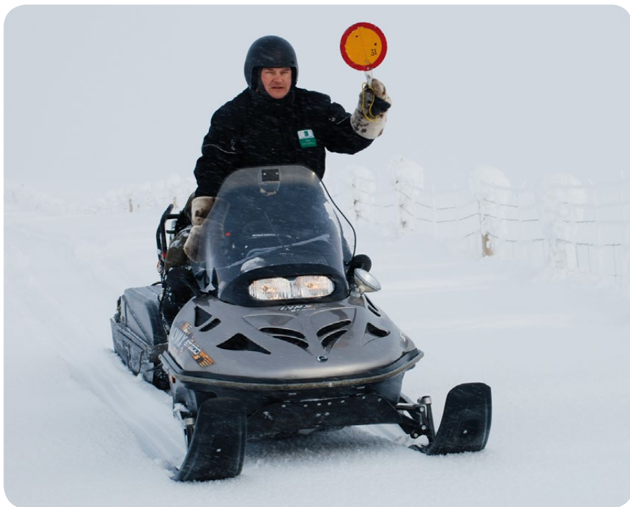
Erätarkastaja moottorikelkkailua valvomassa Lapin erämaassa.

Vuonna 2011 perustettujen Sipoonkorven ja Selkämeren kansallispuistojen käytön suunnittelu alkoi. Sipoonkorven kansallispuiston käyttäjille merkittäviä asioita ovat kulkuväylät puistoon, reittien ja retkeilyrakenteiden sijoittaminen, luontoarvojen turvaaminen ja yhteistyö paikallisten asukkaiden ja sidosryhmien kanssa. Palautetta ja kehittämissuhteita retkeilypalveluista kerättiin karttapohjaisessa verkkopalvelussa.