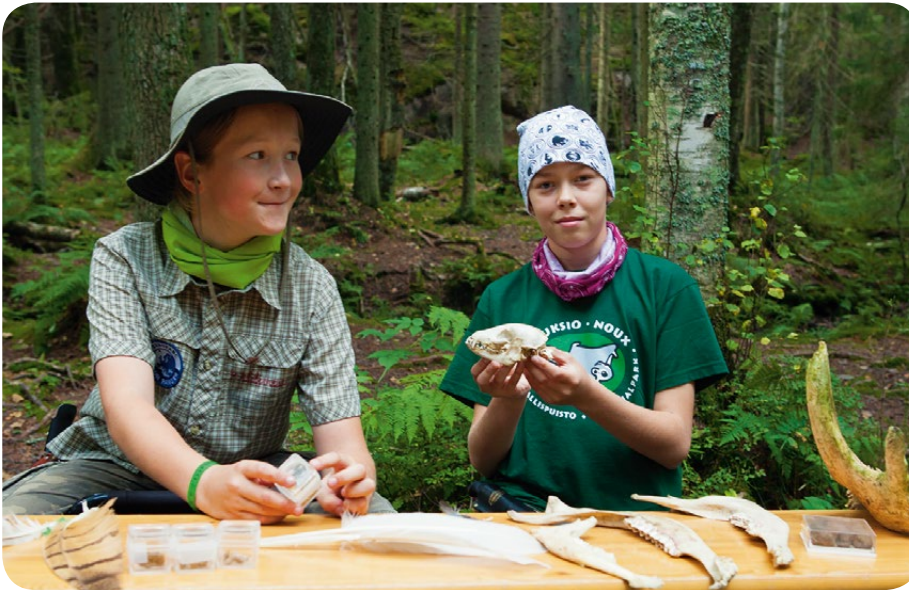
Nuoria luonnontutkijoita Nuuksion kansallispuistossa Espoo-päivän yleisötapahtumassa.

– Se sulautuu hyvin maastoon, ei ole liu-kas sateellakaan eikä vaadi kunnostusta. Myös asennus sujui helposti ja elinkaari-kustannukset ovat puuportaita pienem-mät. Kokeilu jatkuu mm. keräämällä käyt-täjien palautetta.