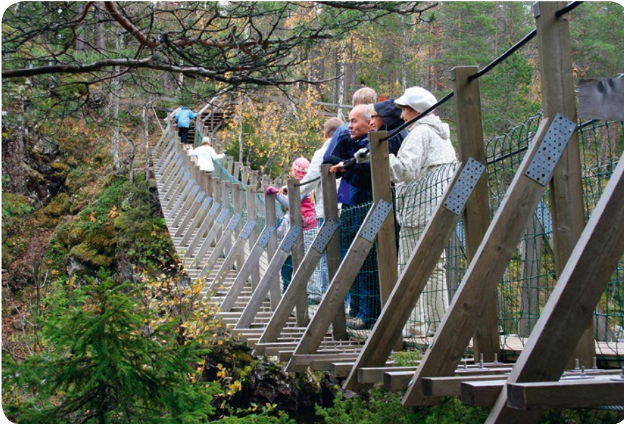
Väestön ikääntyessä kansallispuistojen hyvät reitit ja palvelut ovat yhä tärkeämpiä. Yhteiskunta saa vastinetta tälle sijoitukselle, kun kansanterveys kohenee.

– Luonnossa liikkumisesta voi löytää helpotusta stressiin, mielenterveysongelmiin, painonhallintaan, unettomuuteen sekä motorisiin ongelmiin, summaa projektipäällikkö Kati Vähäsarja Metsähallituksen luontopalveluista.