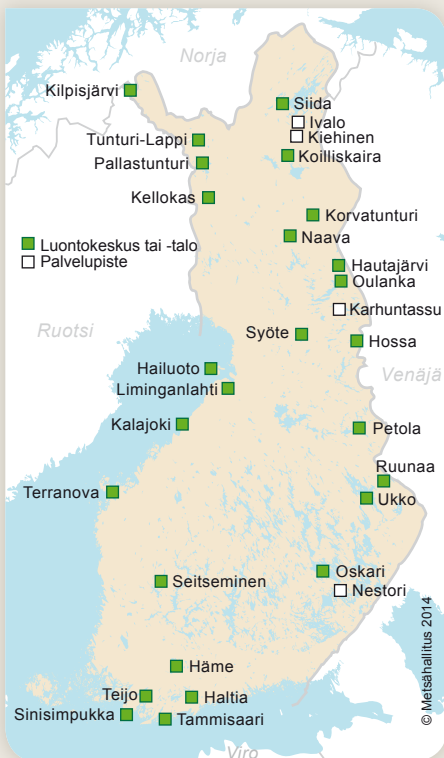
Metsähallituksen luontokeskukset ja palvelupisteet 2013. Yhteystiedot ja palvelut: www.luontoon.fi > Asiakaspalvelu.