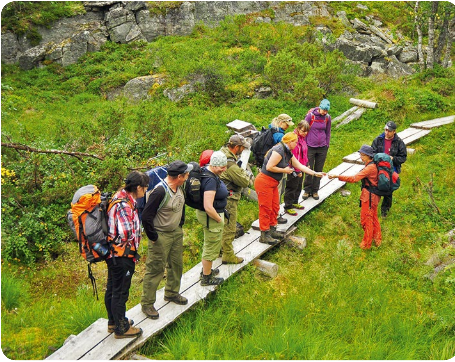
Retkeily kansallispuistoissa, kuten Pallas–Ylläksellä tuo myös sosiaalista pääomaa. Luontoretelle lähdetään yleensä perheen tai ystäväporukan kera.