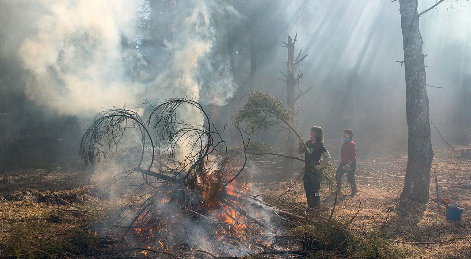
Luontopalvelujen saamalla mittavalla EU-rahoituksella kunnostetaan mm. uhanalaisia perinneympäristöjä. Kirkkonummella entinen pelto muutetaan laitumeksi, kun puut raivataan pois ja karja pääsee laiduntamaan.

ton laajuiselle pinta-alalle. Lähes saman verran, vielä 17 000 hehtaaria suojelualueiden soita, tulisi ennallistaa luonnon monimuotoisuuden parantamiseksi, summaa suojelubiologi Maarit Similä .