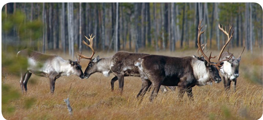
Metsäpeura on poron luonnonvarainen, harvinainen sukulainen, joka on saanut suojapaikan Salamajärveltä Keski-Pohjanmaalta.

– Tähän mennessä on Suomen suojelualueiden soille palautettu luontaisten kaltaisen vesitalous 20 000 hehtaarin alalle eli kaksi kertaa Patvinsuon kansallispuis-