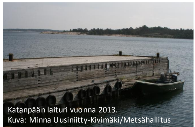
Katanpään laituri vuonna 2013.

Katanpäässä kunnostetaan vesibussien ja muiden isompien alusten käytössä olevaa laituria. Kunnostustyöt aloitettiin kesän 2014 veneilykauden päätyttyä ja uusi laituri on valmiina käyttöön jälleen kesällä 2015. Kunnostustyöt toteutetaan osittain Euroopan aluekehitysrahaston tuella. Entistä ehompi laituri tulee palvelemaan paremmin saaren suuntautuvaa vesibussiliikennettä.