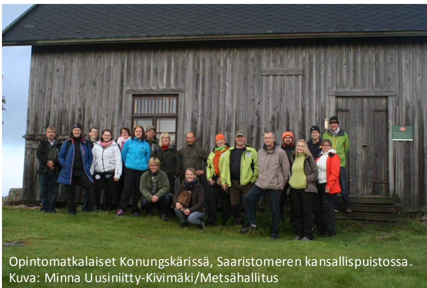
Opintomatkalaiset Konungskärissä, Saaristomeren kansallispuistossa.

Matkailuyrittäjiä ja muita matkailutoimijoita Selkämereltä matkusti syyskuun lopulla opinto- ja ideoimismatkalle Saaristomerelle. Kahden päivän aikana tutustuttiin tiiviissä aikataulussa Nauvossa ja Korppoossa toimiviin erilaisiin matkailuyrityksiin sekä Saaristomeren kansallispuistoon, mutta myös toisiin. Työpajoissa ideoitiin ja keskusteltiin erilaisista keinoista, joilla matkailua ja yhteistyötä voitaisiin Selkämerellä kehittää. Uusia ideoita, ajatuksia ja yhteistyömahdollisuuksia saatiinkin Saaristomereltä mukaan jonkin verran, ja näitä lähdettiin kehittämään eteenpäin yhdessä ja erikseen.