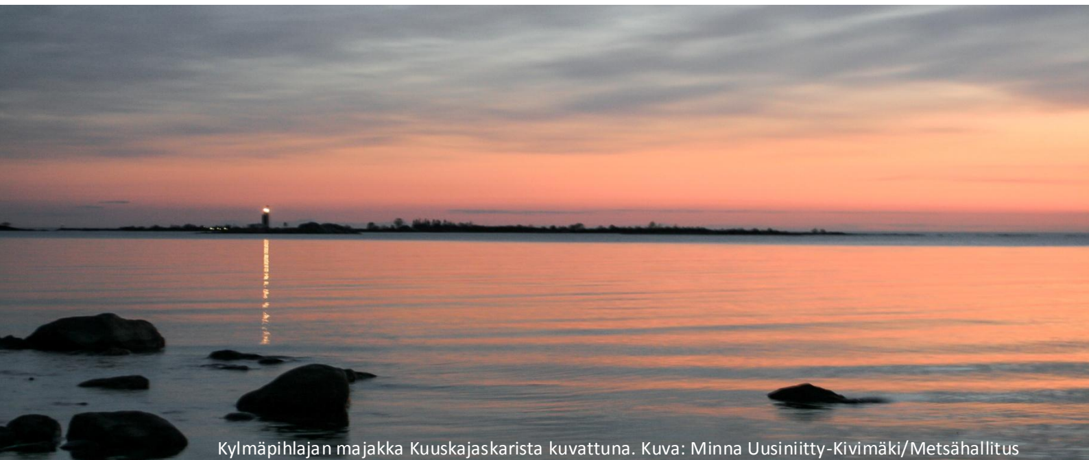
Kylmäpihlajan majakka Kuuskajaskarista kuvattuna.