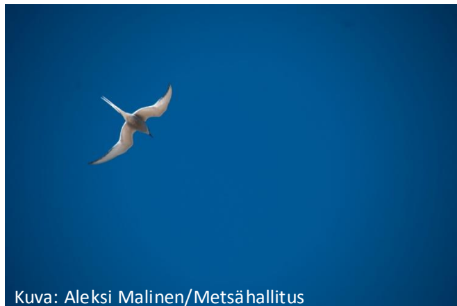
Kuva: Aleksi Malinen/Metsähallitus

http://yle.fi/aihe/artikkeli/2014/10/28/uusi-kamerateknikka-vie-la-hemmas-luontoa