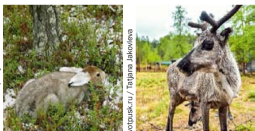
Metsähallitus / Anja Vest