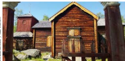
Metsähallitus / Ida Ikonen

Pielrajärvi через сосновый бор и множество небольших озер.