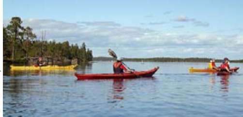
Metsähallitus / Olli Välimä

Прекрасная возможность насладиться чарующими видами озера Инари с многочисленными хребтами островов — сплав на каноэ. Располагающиеся неподалеку бурлящие речные пороги Jäniskoski принесут массу ярких впечатлений даже искушенным любителям активного отдыха.