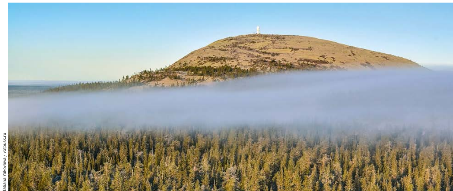
Tatiana Yakovleva / vopusk.ru