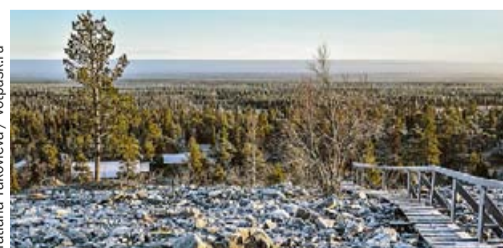
Tatiana Yakovleva / vopusk.ru