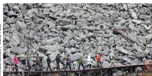
Metsähallitus / Juha Paso