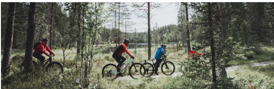
METSÄHALLITUS 10/2023.