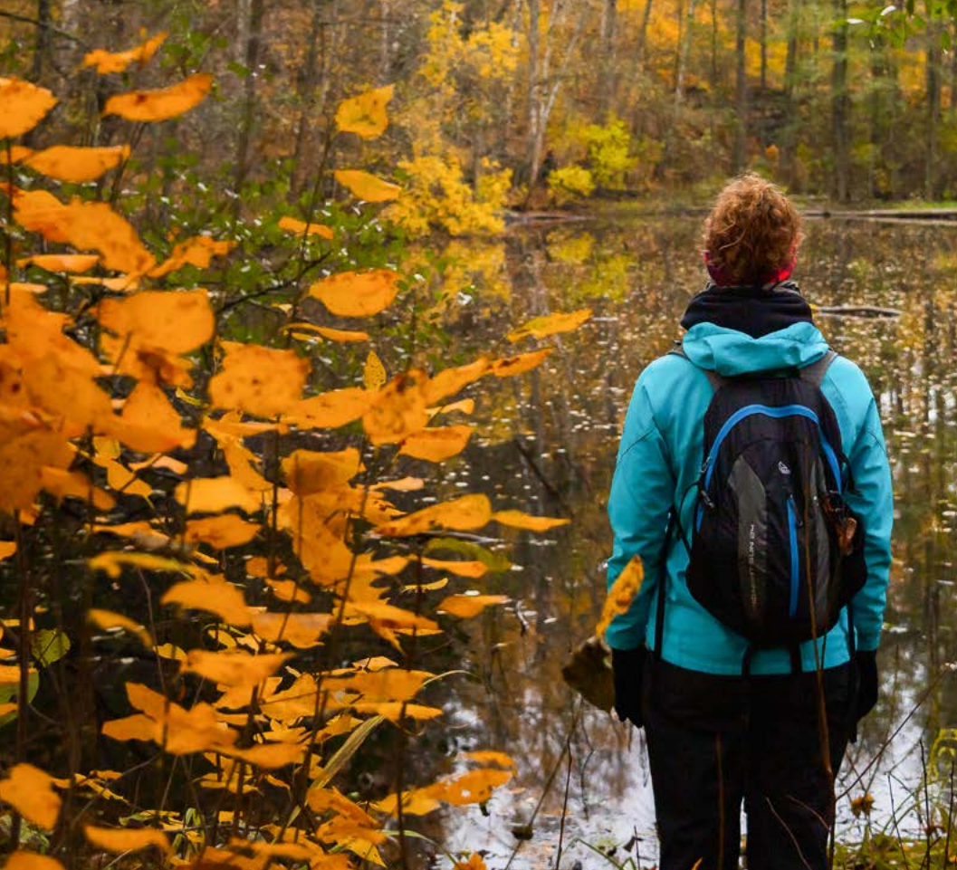
Teijon kansallispuisto.