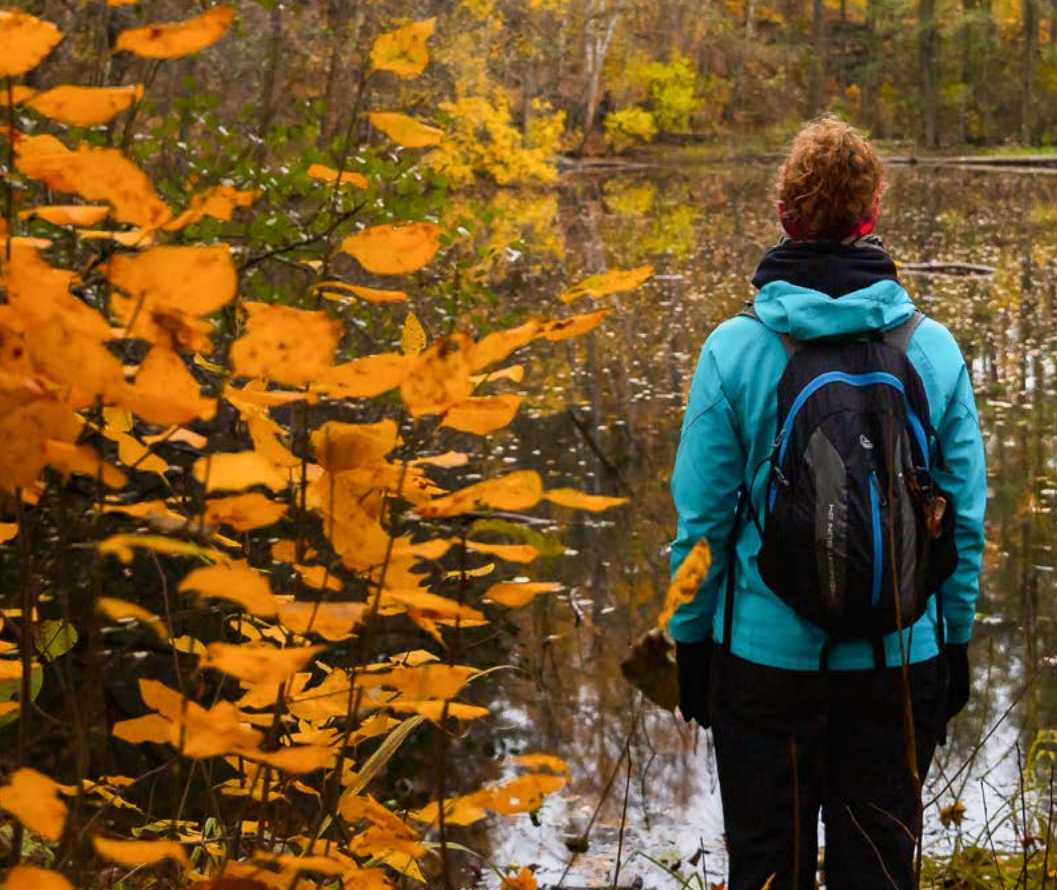
Tykö nationalpark.