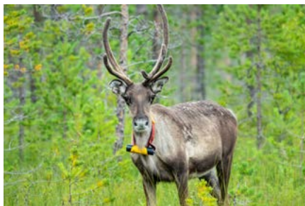
METSÄHALLITUS 10/2021, KUVAT: ISMO LAMPI

Saunakankaan autiotupa sijaitsee keskellä Olvassuon luonnonsuojelu-aluetta Piltuanjoen varrella. Tuvalle ei johda merkittyjä reittejä. Sisälle mahtuu 10 henkilöä, varustuksena on kaasuliesi ja kamiina.