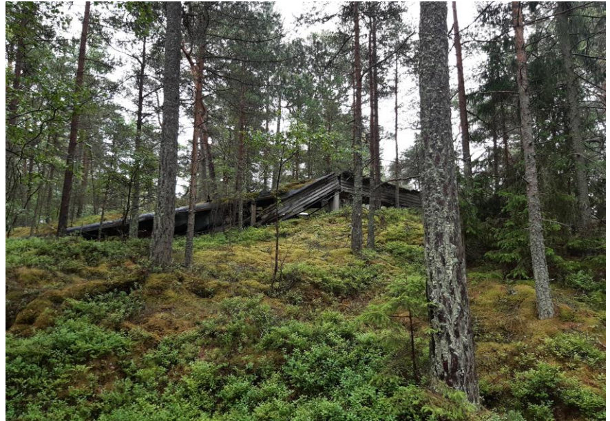
Förfallna konstruktioner från gruvverksamheten på Jussarö.