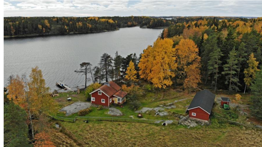
Höst på Rödjans fiskehemman.