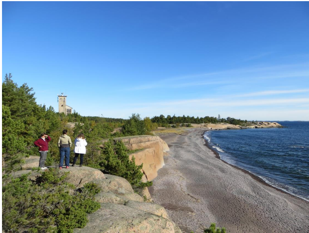
Jussarö – besökare på Iron Beach.