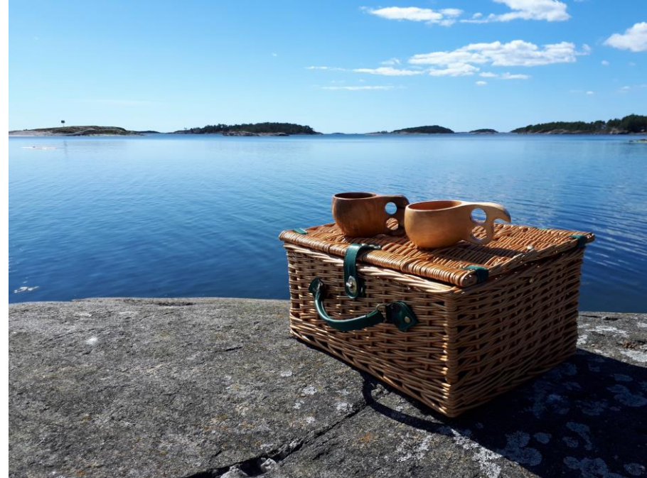
Vacker plats att äta sin matsäck på.