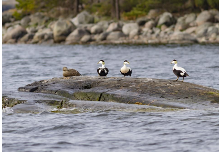
Ejdem är nationalparkens symbol.