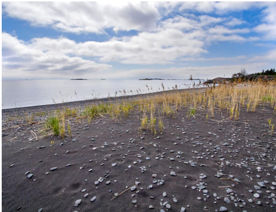
Iron Beach - sandstrand med rester av järnmalm på Jussarö.