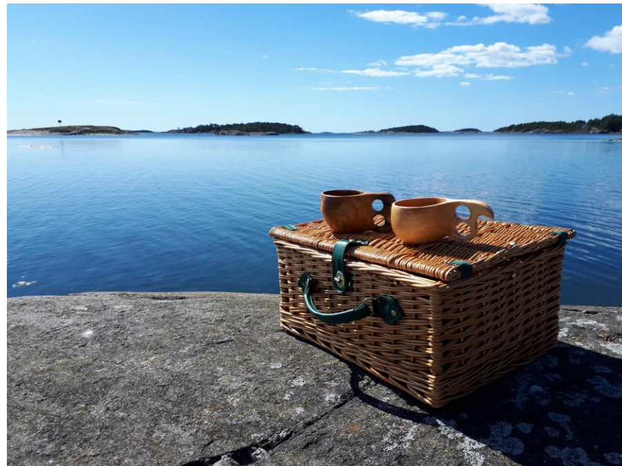
Maisemapaiikka eväiden syönnille.