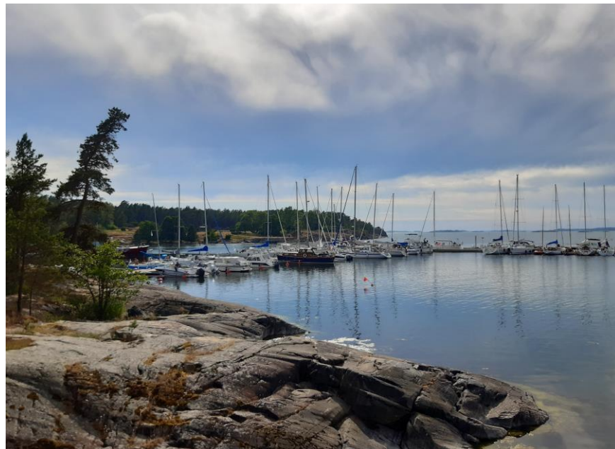
Veneilijöitä saaristossa, Jussarö.