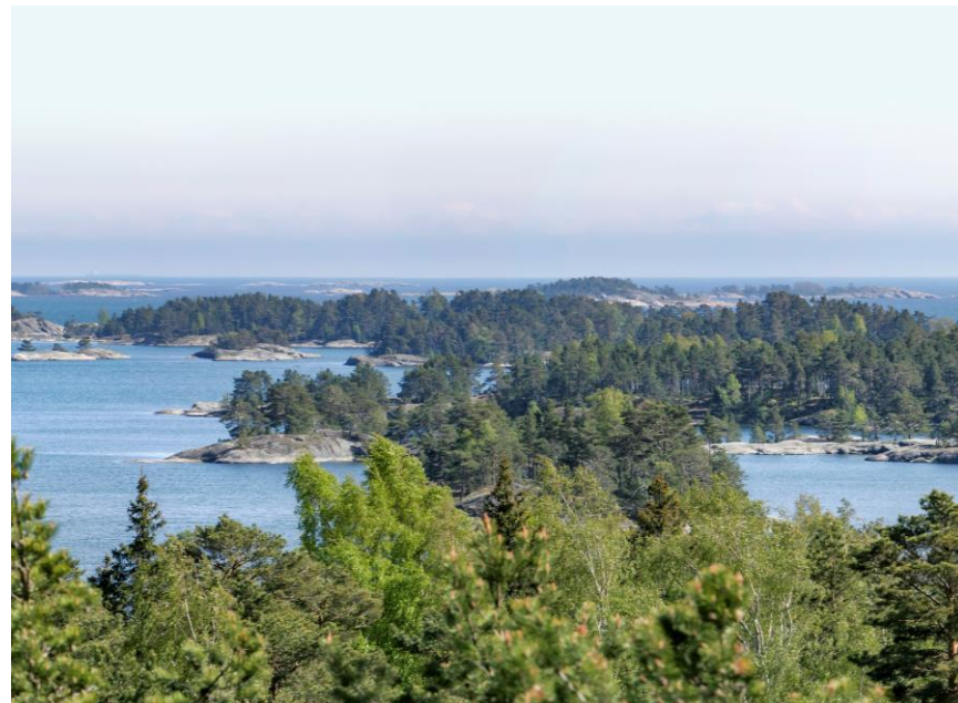
Veden muovaama saaristo.