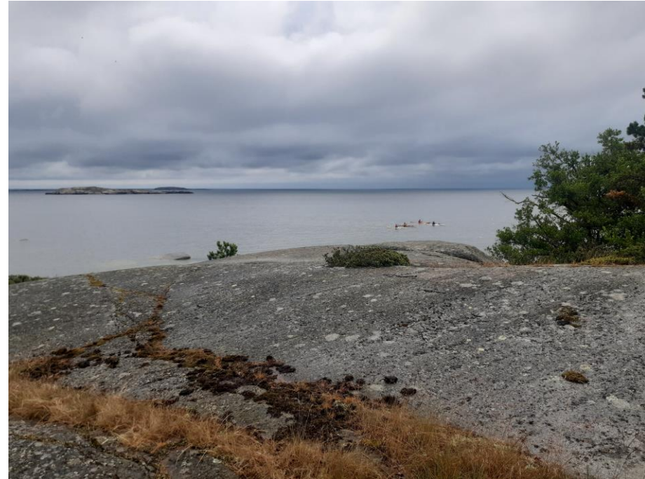
Melojat Jussarön edustalla.