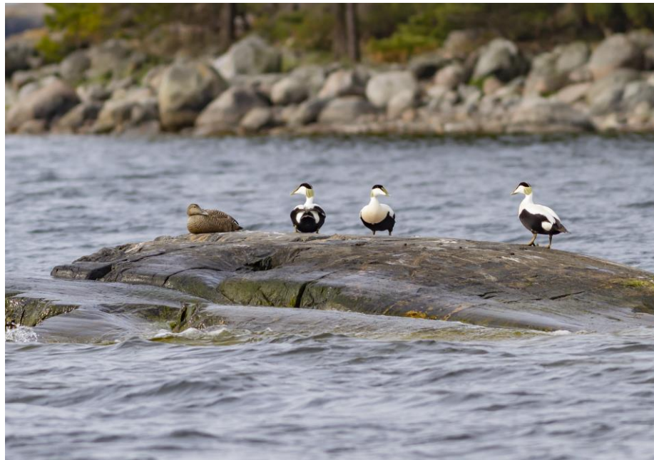
Haahkat ovat kansallispuiston tunnus.