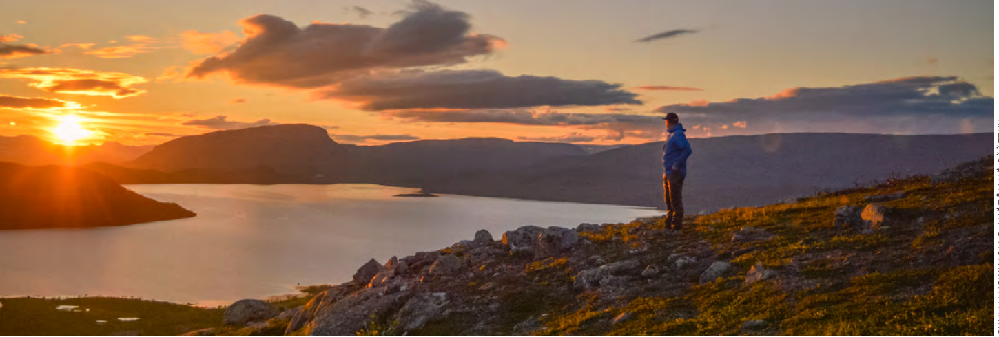
SUVI MANSIKKASALO / YÖTÖN YÖ PÄÄTTY