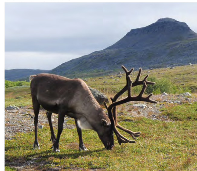
SEIJA OLKKONEN / PORO JA SAIVAARA (ČÁIVÁRRI)

Suurtunturit ovat saamelaisten poronhoitajien arkinen työympäristö. Poronhoitoalueella liikuttaessa tulee välttää porojen häiritsemistä. Jos avaat veräjän, muista sulkea se. Veräjä voi olla myös tarkoituksella auki, jolloin se tulee jättää auki.