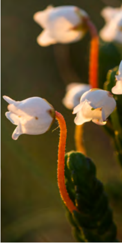
SEIJA OLKKONEN / LIEKOVARPIO

Tunturiiniityt elättävät perhosia, joiden toukat syövät vain tiettyjä tunturikasveja. Yöttömän yön ansiosta perhoset lentävät lämpiminä päivinä yötä päivää. Ännjaloanjin luonnonsuojelualue on perustettu uhanalaisten perhosten turvaksi, eikä sen alueella saa kesäaikana liikkua.