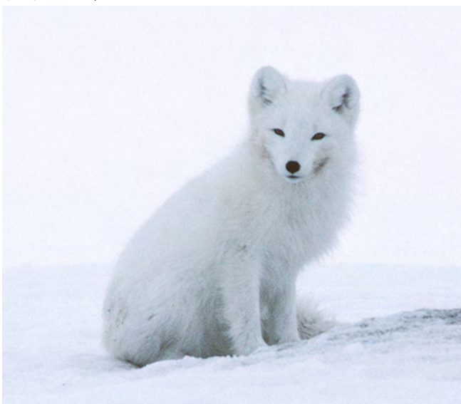
SEPPÖ KERÄNEN / NAALI TALVELLA

Pohjoismaiden tutkijat ponnistelevat yhdessä naalin pelastamiseksi. Naalikantaa pyritään tukemaan siirtoistutuksin, ruokinnalla ja kettuja vähentämällä.