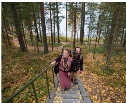
METSÄHALLITUS 02/2023.