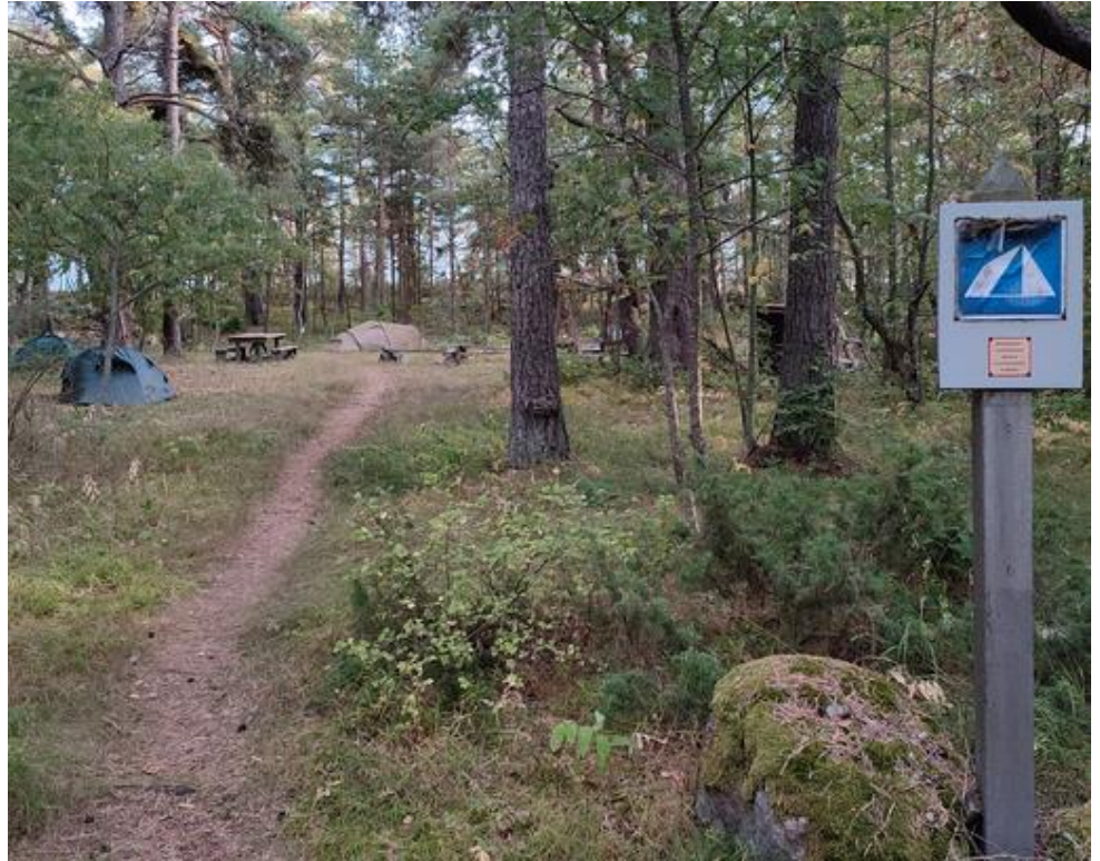
Ulko-Tammion telttailualue.