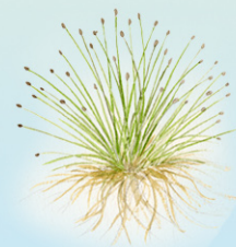
tupasluikka Trichophorum cespitosum