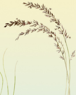
siniheinä Molinia caerulea