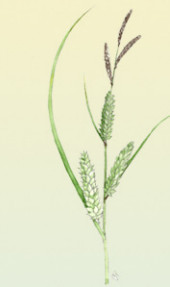
pullosara Carex rostrata