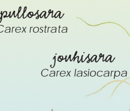
jouhisara Carex lasiocarpa