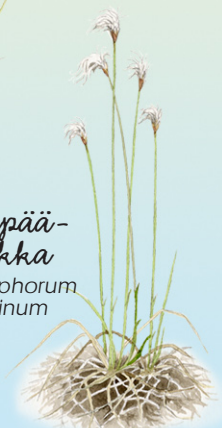
villapää- luikka Trichophorum alpinum