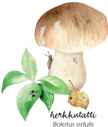
herkkutatti Boletus edulis

Reitille pääsee Kaihuanvaaran rengastien varren pysäköintialueilta. Reitti kulkee Kaihuanvaaran metsäisessä rinteessä ja