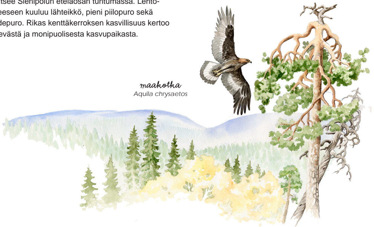
maakotka Aquila chrysaetos

Alueella viihtyvät mm. monet kolopuita käyttävät lintulajit, kuten pohjantikka ja palokärki. Kaihuanvaarasta ja Namalikkokivalosta löytyy jääkauden jälkeisiä merenrantamuodostumia. Namalikkokivalolla ei kulje retkeilyreittejä, mutta omatoimisesti alueeseen voi käydä tutustumassa.