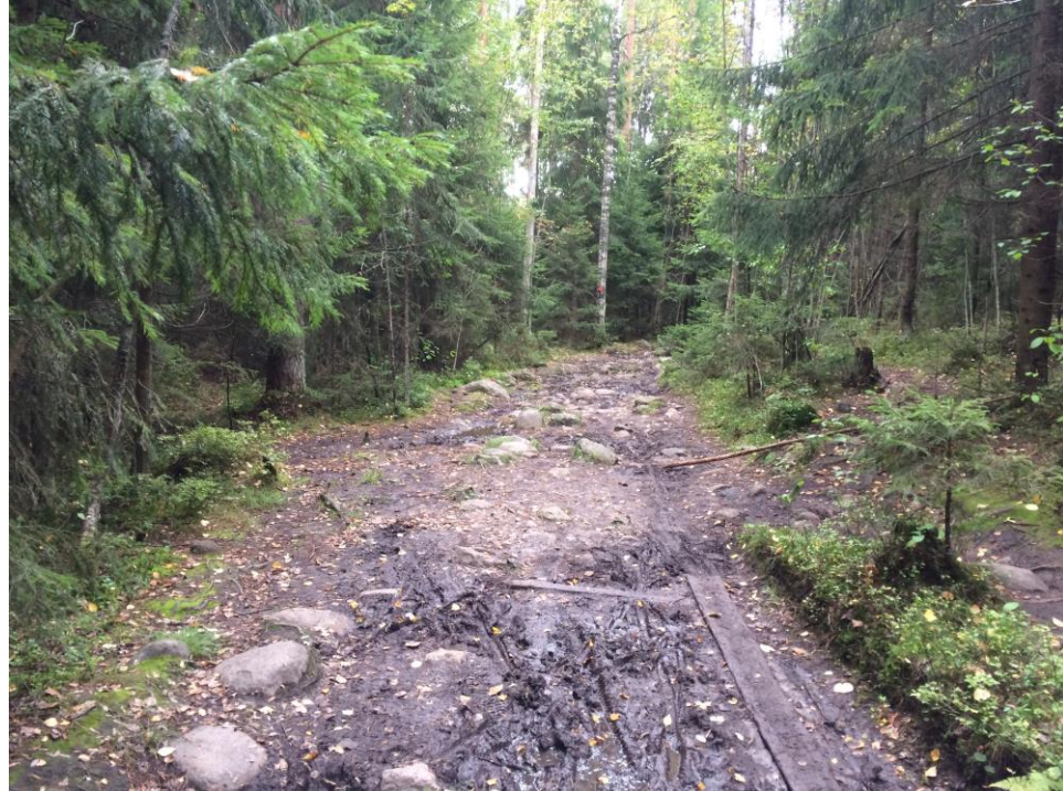
Kulunut polku.