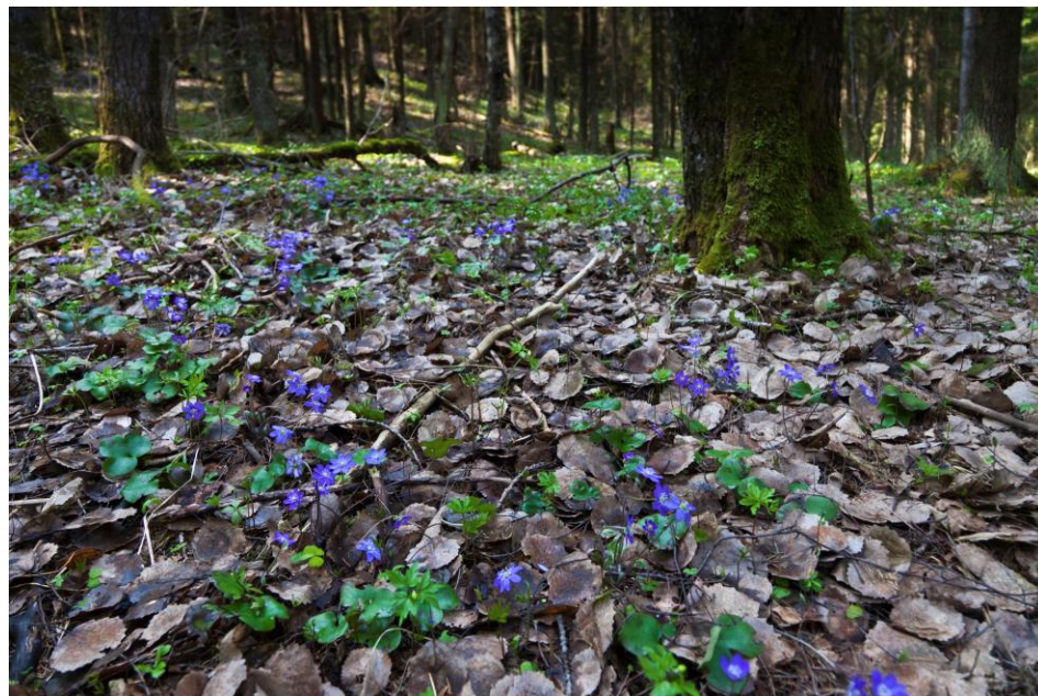
Sinivuokot metsässä.