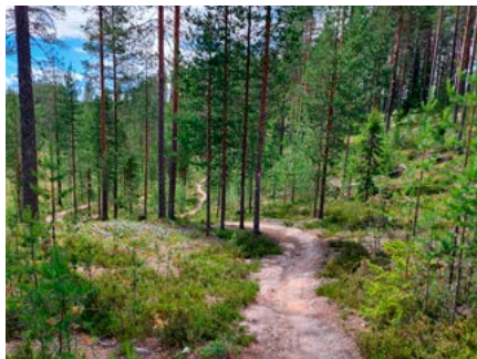
METSÄHALLITUS 9/2023.

risteykseen, josta jatkat kohti pohjoista samaa reittiä Syötteen kierroksen kanssa. Tällä reittiosuudella eteesi tulevat Riihisuon pitkät pitkospuut, vanhassa metsässä kiemurteleva osittain kivinen maasto sekä loppuun loivahko lasku pitkossiltoineen sekä sorapolkuineen. Loppumatkan taitat takaisin tuttua polkua latu-uralla kohti Luppovettä ja luontokeskusta.