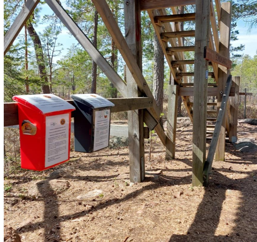
Postilaatikkokeräys Valkmusan luontotornilla.